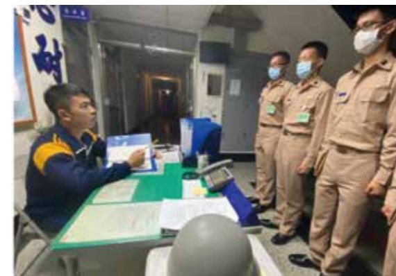
於新生隊擔任分隊長進行留守交接