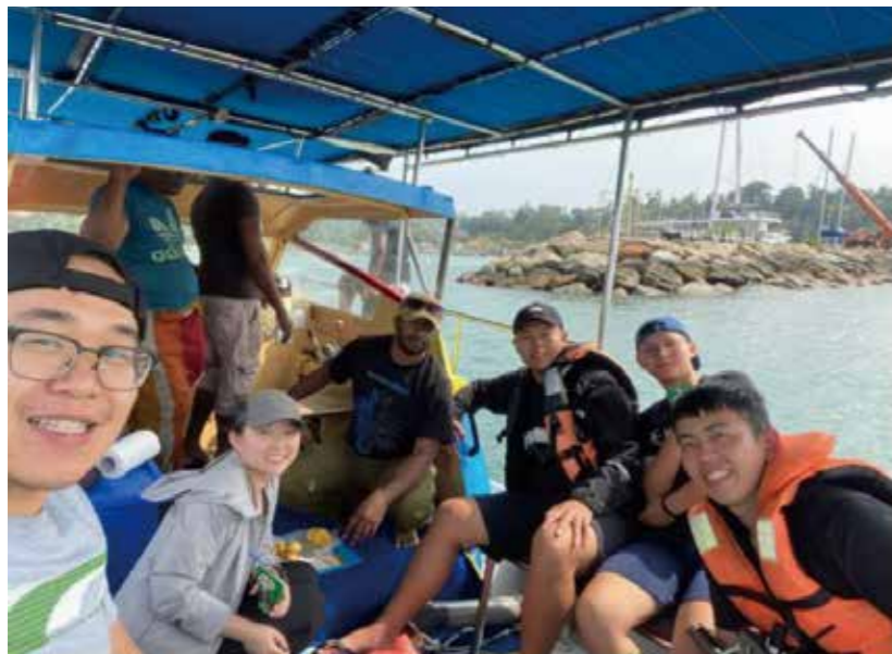
斯里蘭卡學術交流及移地研究

三年級時，與國立中山大學{碳}索實驗室的研究團隊到小琉球進行錨定實驗的過程中，那是我人生第一次離開臺灣本島到小琉球，當時正值冬天我們頂著寒風在小船上，將沉積物收集器及重錘放入海中，時隔一日才將其回收，但這真是噩夢的開始，要將沉重的儀器以人力拉出海水，可謂是使出吃奶的力氣啊；隨後又安排了隨海研三號出海航次我們去到了南海，身為海軍官校學生，這是我第一次長時間出海生活，也是第一次在專題研究中體會到海上研究作業的辛苦面，要在特定測站實施採水，深達3000m的海水好冰喔，