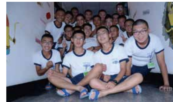
在生活中與新生合影

費的身分出國至斯里蘭卡，說實話我英文不好也不是特別優秀，我作夢也沒想到公費出國竟能在我官校時實現，我暨興奮又期待，因為這同時也是我人生的第一次出國，我和國立中山大學{碳}索實驗室及國立臺灣海洋大學的研究團隊一同到斯里蘭卡學術交流及移地研究工作共計9天，主要進行了內貢博瀉湖與偉利格默海灣的水文及生地化調查及樣品採集。回國後論文的工作則是如火如荼的進行，我們以「The impact of eddies on nutrient supply, diatom biomass and carbon export in the northern South China Sea」為題，探討南海北部的渦流對營養鹽供應、海洋微型浮游藻類生物量及碳輸出的影響。隨著截稿期限將至，我和教官