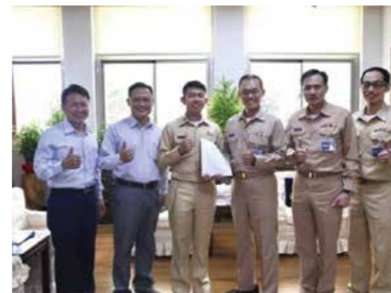
論文發表與校長及各長官合影

農曆過年時我們還用通訊軟體及電子信箱往來討論研究內容，有時候我會粗心用錯，而遭到教官嚴厲的指正改進，他常說我們投稿的是國際期刊，需要細心謹慎的撰寫，一旦小細節沒注意，將成為國際笑話；在論文撰寫期間教官讓我參加了臺斯國合計畫之學術交流暨移地研究，我以公