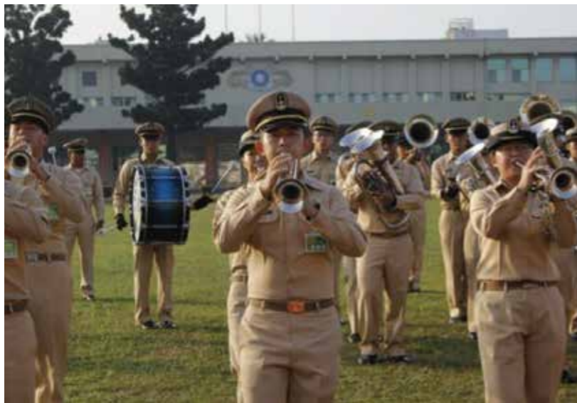
鼓號樂隊為小號組練習時的照片

我的生活，尤其在此次發表的論文能被接受後，對我這些年的專題研究之路，劃下美好的 { 逗點 }。過程中的每件人事物讓我感到新奇不已，開拓我的視野，見識到許多未知的領域，更重要的是，從事專題的過程，讓我更能夠學習專心、冷靜、有