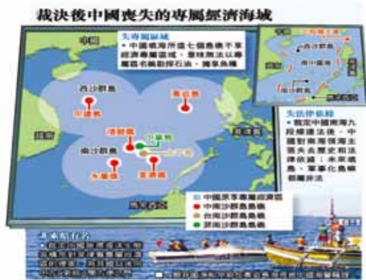
圖3 南海仲裁後中共喪失之專屬經濟海域圖

TPP 是美國「亞洲再平衡」政策的核心支柱，它所促進的貿易和成長，將會強化美國的安全結盟和區域伙伴關係；它將為亞洲帶來更多的整合和信賴。歐巴馬再次強調，如果不能繼續推動TPP，不僅會有經濟後果，也會讓人質