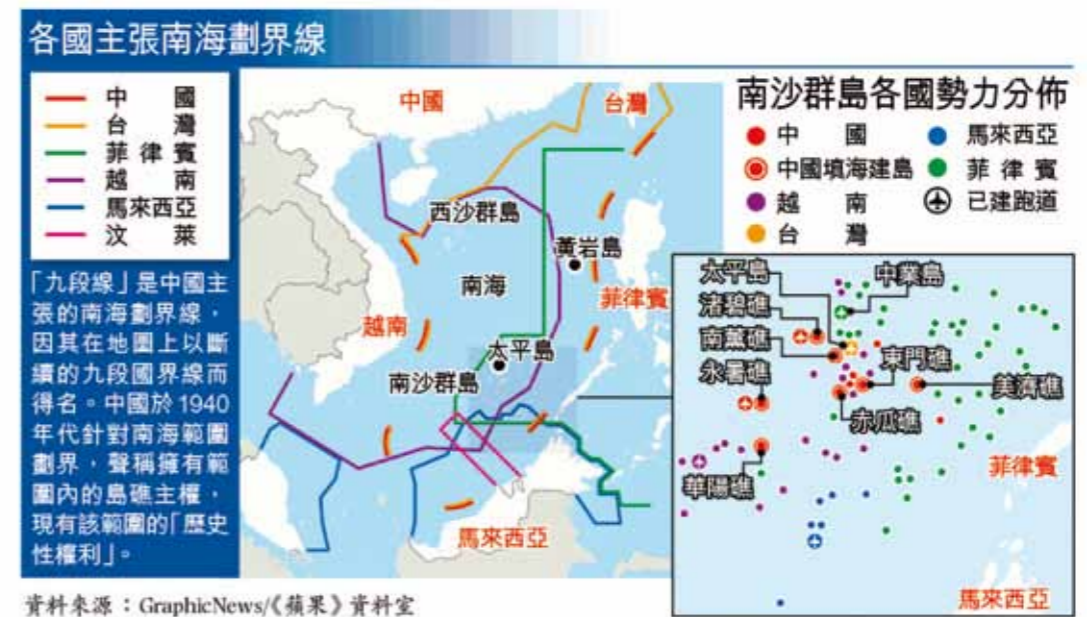
圖1 南海各國主張劃界示意圖

然而，中共近年來積極在南海岩礁上派遣挖砂船進行填礁建島，除了用於宣示主權及聲明經濟海域與大陸棚的權利外，還有就是增建新