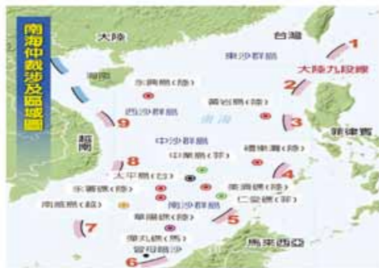
圖4 南海仲裁涉及區域圖 資料來源：< http://www.chinatimes.com/newspapers/20160713000336-260102 > (檢索日期：2016年11月30日)

疑美國在亞洲這個重要地區的領導力。更藉此維持和延長其霸權在亞太地區於不墜，有助於爭取戰略空間及換取可資運用的時間，兼用軍事優勢爭奪亞太地區的經濟效益，延緩中共崛起的速度。 19 故不容小覷TPP的結盟優勢，但其後美國總統當選人川普上台後可能產生變數，甚至完全政策大轉彎，將充滿許多不確定因素。