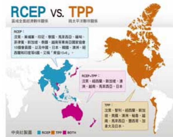
圖5 RCEP與TPP之成員國分布圖

亞投行視為中共藉此對抗由美、日主導的世界銀行及亞洲開發銀行。TPP和AIIB雖然同為經濟組織，但亞投行和TPP還是有區別的。明顯區別在於，亞投行是有抵押貸款，TPP是相當於自貿區免稅。此外，兩者的成立到簽署期程以及加入成員國數量更是大相逕庭。以TPP為例，其從2002年開始提出到簽署協議周期超過10年，而美國加入後也用了5年多才簽署協議，共12個會員國。與之形成鮮明對比的則是亞投行，從2013年10月中共國家主席習近平自提出到成立僅用大約一年時間，從成立到確定創始成員國約半年，而從確立創始成員國到投入運行亦僅半年而已。從提出到開始投入運營，僅僅兩年多時間。2015年4月15日，亞投行意向創始成員國確定為57個，其中域內國家37個、域外國家20個。在美國TPP戰略難產過程同時，中共卻開始了在世界範圍的戰略布局，以一帶一路和與之配套的亞投行共同開啟中國新絲路。