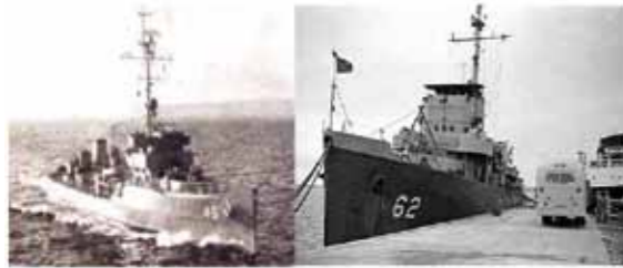
圖4 劍門及章江艦 (參考資料 http://www.rocnp.org/thread-19534-1-5.html 及 http://natac.pixnet.net/blog/post/99732565 )

務。條約內容是以軍事為基礎，一旦台澎金馬地區的領土保存及政治安定，遭遇到外界及共產黨武力攻擊時，兩國應相互援助抵抗。而且，為了防禦上述地區及周圍，台灣當局允許美國陸海空三軍軍備之需，意即，如果台灣地區發生戰爭時，美軍便有義務協防台灣；而台灣如果沒有經過美國同意，也不得對中國大陸發動軍事行動。從海權的論點來看，該條約雖提供台灣海峽的若干防衛需求，但也嚴重地限制海軍渡海作戰的發展。