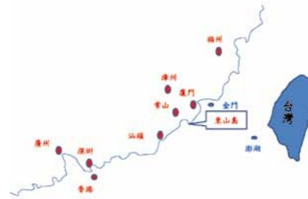
圖2 東山島位置示意圖（作者自繪）

1947年起美英兩國為防範蘇聯借戰後混亂之機，進行並擴張共產主義，民主政治與共產主義進入冷戰時期，美國企圖複製一類似「北大西洋公約組織」於亞洲，以便進行與共產主義國家的抗衡。1945年第二次世界大戰後北越（越南民主共和國）與法國進行長達9年的獨立戰爭，1954年5月8日在奠邊府一役擊敗法國，同年7月21日9國外長簽定「日內瓦協定」，但美國及南越政府並不支持；在美國方面為防止共產主義在亞洲繼續蔓延，與東南亞各國採取圍堵策略。1950年