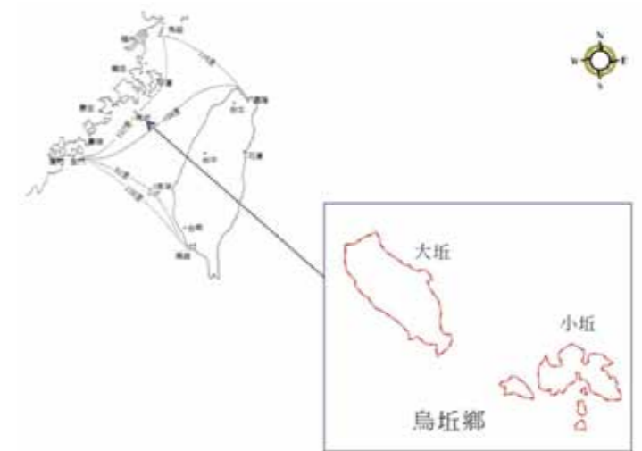
圖3 烏坵地理位置

台海中立化，民41年中共砲及大擔、二擔，42年元月砲擊金門，7月27日板門店停戰協議生效，中共兵力逐漸轉移至東南沿海；43年中共砲轟金門（金門砲戰），8月周恩來宣示「解放台灣」。美軍基於臺灣在地緣戰略上，與日本、南韓、菲律賓、泰國、澳大利亞和紐西蘭，對於遏制共產主義在東亞地區的擴張，具有重要的戰略地位，為西太平洋地區安全體系的重要環節。為使臺灣正式加入美國所發起的安全體系，並提供長期穩定的軍事和經濟援助整體方案，美軍基於台海情勢及因應對策考量，於1954年12月3日，兩國簽署了中美共同防禦條約（Sino-American Mutual Defense Treaty），美方隨即派遣海空軍部隊駐台，擔任協防台灣任