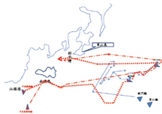
圖5 八六海戰示意圖（作者自繪）

1. 我軍：指揮官為海軍巡防第二艦隊司令胡嘉恆少將率劍門、章江軍艦二艘（如圖4）