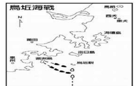
圖7 烏坵海戰示意：（資料來源：捍衛台灣的真實故事-碧海左營心）

1. 共軍：魚雷快艇四艘、快速砲艇七艘及P F一艘。其中護衛艇31大隊的573、579艇與護衛艇29大隊的576、577艇組成第1突擊艇群，主攻「山海」艦；護衛艇29大隊的588、589艇組成第2突擊艇群，牽制「臨