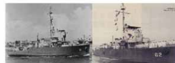
圖6 臨淮及山海艦 (參考資料 https://tw.search.yahoo.com/search?p=%E6%B0%B8%E6%B3%B0%E8%BB%8D%E8%89%A6&fr=yfp-t-900-s-tw&ei=UTF-8 )

海軍遵奉國防部令，執行指定任務，以東山島為目標，實施兩棲偵察及海上突擊襲擾，並相繼摧毀敵雷達站，以（D-Day）作為正式攻擊發起日期。8月5日晨，巡防第二艦隊司令胡嘉恆少將率劍門、章江兩艦及搭載陸軍特種情報人員執行「海嘯一號」任務，行前為求保密，在離左營港前往目標區一東山島，還運用欺敵作為，先航駛海南島進行欺敵戰術，而後在北上東山島海域進行滲透，並偵測登陸作戰所需情報，同時由空軍協力支援。然而作戰情報早已洩密，兩艘軍艦從左營出發後就已經受到解放軍的監視，解放軍魚雷艇已先行部署於東山島海域附近之兄弟嶼進行伏襲；8月6日凌