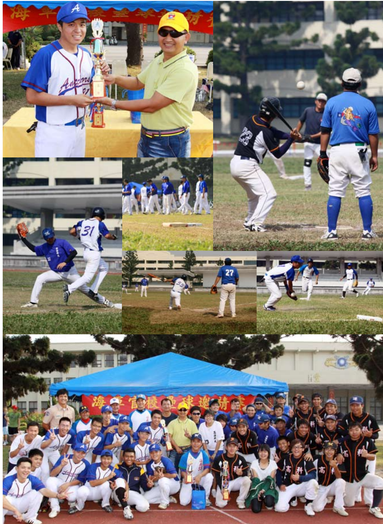
98.10.31 棒壘社舉辦壘球邀請賽