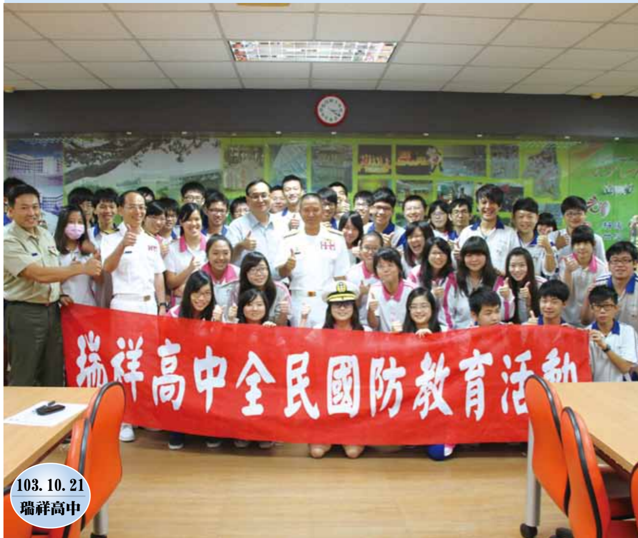
103. 10. 21 瑞祥高中