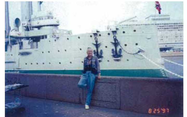
作者與阿芙羅拉號

”阿芙羅拉”巡洋艦，建於1903年，是俄羅斯第一次世界大戰(1914)前的巡洋艦，艦名俄文是”Аврора”中文讀音是”阿芙羅拉”，英文為”AVRORA”。1997年8月25日，我與家人前往蘇俄旅遊，在聖彼得堡大涅瓦河碼頭，看見”阿芙羅拉”巡洋艦，使我好奇的是她的兩舷各有兩個大鐵錨，原來早期俄羅斯的巡洋艦，都是兩舷各有兩個大鐵錨。我覺得它不是備用的鐵錨，而是為了在內港或狹窄泊地倒俾下錨時，先拋下前錨稍後退俾再將後面的錨拋下，這樣就在漲落潮