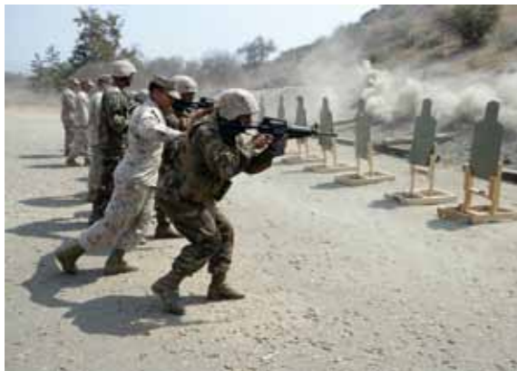
美國陸戰隊教官於加州的Pendleton營區，指導外邦受訓學員進行近戰射擊

領地。以雅典為首的希臘聯盟，先於西元前480年時在數次的「薩拉米斯海戰」(Battle of Salamis, 亦夾含有陸戰，地點在今賽普路斯島東部海域暨沿岸陸地)中，擊退埃及大軍而成為控制地中海的霸主；接著又於西元前478年時擊敗入侵的波斯大軍，使得希臘的疆域和文明不致遭併於埃及或波斯帝國。惟僅約一甲子左右，雅典和斯巴達兩個城邦又為了爭奪聯盟盟主之地位和多方面的利益，而在西元前415年爆發了持續長達27年之久的「伯羅奔尼戰爭」(Peloponnesian War)。