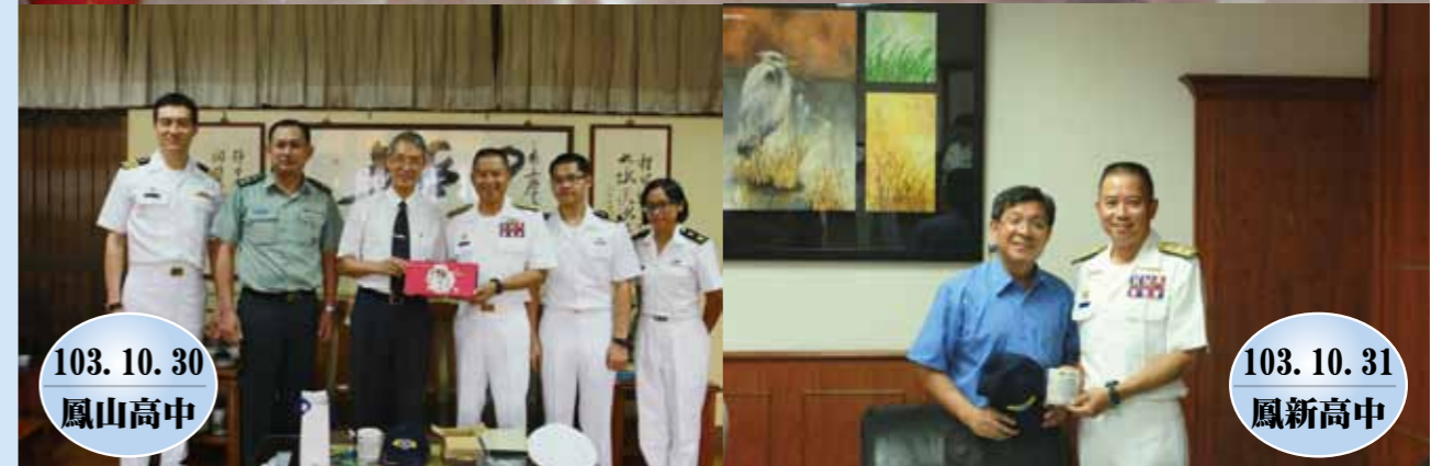
103. 10. 30 鳳山高中