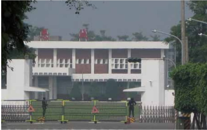
設施完善的「海軍陸戰隊學校」 (ROC Marine corps school)

健身手和鋼鐵毅力，則可凌駕舉世各國的兩棲、三棲部隊。像是陸戰隊兩棲偵搜大隊 (Amphibious Reconnaissance and Patrol Unit) 的隊員們於完成訓練之前，必須以匍匐、翻滾和各類戰姿通過的「天堂路」，便是僅見於我國的壓軸訓練項目。通過嚴實偵搜特訓的學員正如「鯉躍龍門」一般，成為足可制浪伏波、潛海涉渡，以及馳驅陸岸、縱橫灘頭的殊勇戰士，此一情境在去(2013)年的有線電視頻道中曾被多次播映，咸信不少國人仍皆留有極為鮮明的印象。