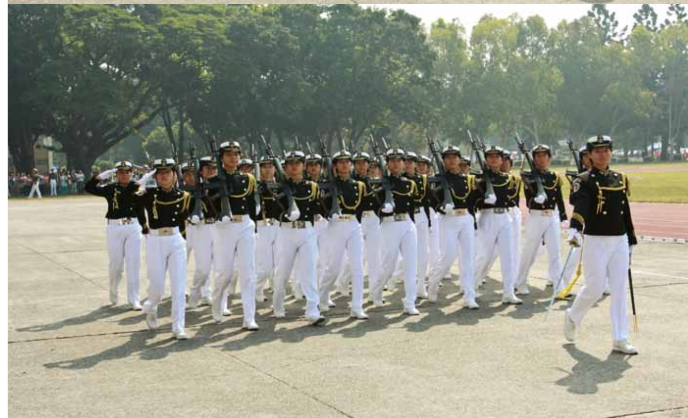
封面：103年10月17日 於海軍官校，圖為本校慶祝67週年校慶活動花絮。