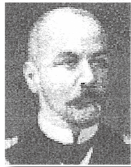
俄國主將齊諾維·羅哲斯特文斯基中將

戰績輝煌的日本聯合艦隊，其戰艦已整修一新、彈藥充足士氣高昂，指揮官東鄉平八郎留學英國皇家海軍大學有年，是日本海軍將領中的佼佼者，是一位善於運用戰術的奇才。