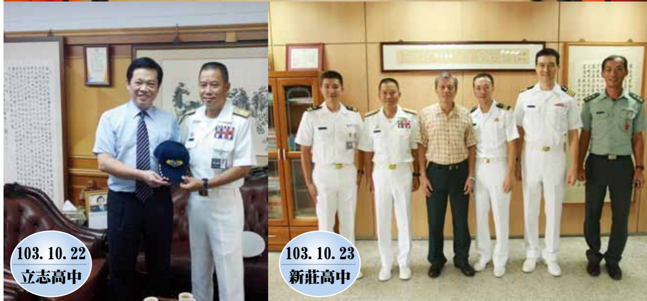
103. 10. 22 立志高中