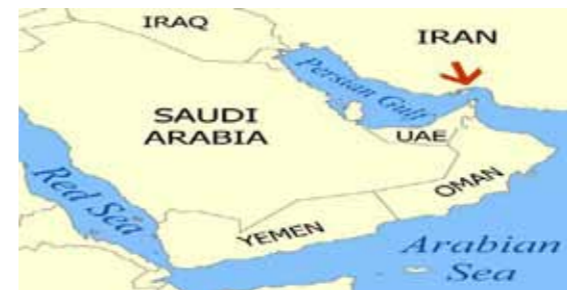
圖1 伊朗與荷姆茲海峽關係示意圖

http://en.wikipedia.org/wiki/Strait_of_Hormuz#mediaviewer/File:Hormuz_map.png （檢索日期2014年6月30日）