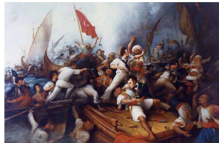
1804年8月3日，美國海軍陸戰隊於「巴巴里戰爭」(Barbary War)的登陸戰中，和黎里波里的敵軍激烈交戰

這場發生於埃克諾姆斯角鄰近海域的戰爭，得被視為是繼特洛伊戰事之後，舉世具宏大規模的第二次海戰和登陸作戰。嗣後，羅馬則由原屬元老院控制政權的國家，轉變為由凱撒、屋大維…等君王掌握實權的帝國(凱撒於行將稱帝前遇刺身亡，故未能及時稱帝)，並再往後延續數百年之久的國祚(若是算至東羅馬帝國遭到滅亡為止，則延續約1,500年)。擁有強盛威勢的艦隊和堅實的登陸作戰部隊，正是維繫羅馬帝國得以長遠存在的重要因素；不過，基於當時的觀念和編制、名稱，軍史專家並未視上述的登陸作戰