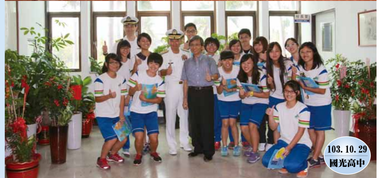
103. 10. 29 國光高中