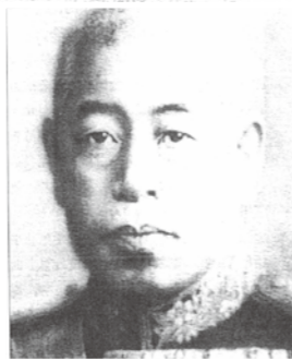
日本聯合艦隊指揮官東鄉平八郎

1905年5月27日俄國太平洋第二分艦隊駛入對馬海峽，展開日俄對馬海峽激戰。因俄國戰艦老舊，機器毛病百出，水兵忿忿不平，軍官訓練不良，而即將與之交戰的卻是有過