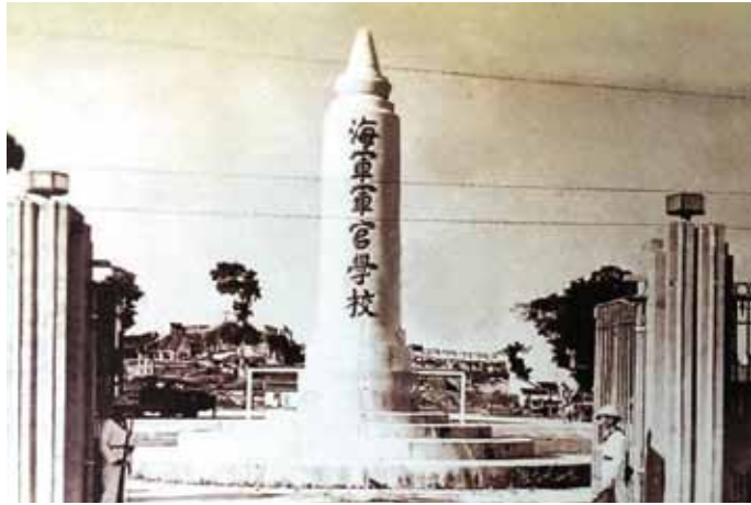
圖 1 廈門時期海官校「精神堡壘」

那麼，何謂「精神」？2004年版的《國軍軍語辭典》：「精神戰力乃無形之戰力，以人之精神力為基礎，產生於人員的心智活動，其構成要素為思想 5 、武德 6 、武藝 7 三者。」 8 又如孫中山所說：「武器為物質，能使用此武器者，全恃人之精神。兩相比較，精神能力實居其九，物質能力僅得其一。…兵法云：『先聲奪人。』所謂先聲，即精神也。準是以觀，物質之力量小，精神之力量大。」 9 換言之，精神力量是無窮的，不是用數字所得而計算，物質力量是有限的，卻可以用數字正確的計算出來。