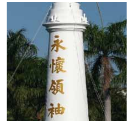
圖 5 精神堡壘正面—蔣中正銅像及永懷領袖字樣 (民國 64 年以後)

蔣中正銅像拆除後，不久依海軍官校辦教育之特色，即走向多元化教育，兼重航海、戰略、戰術等，隨即換上代表航海標誌的錨和舵輪，原始