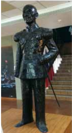
圖 6 精神堡壘上的蔣中正銅像被移置軍史館