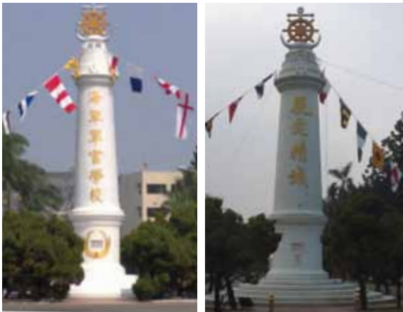
圖 7 精神堡壘正面與壘頂—航海的標誌（民國 96 年以後）