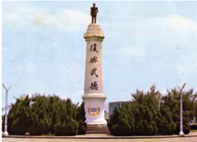
圖 4 精神堡壘—蔣中正銅像及復興武德字樣 (民國 56 年)

有軍、軍中有黨，以及以黨領軍等特徵。 27 民國 38-45 年，是國軍參與統治顯著時期。一方面，中央政府由蔣中正、陳誠及許多具有深厚軍事背景的人主導，省政府也一直由現役將領擔任主席。 28 加上，海軍官校在當時爆發幾起白色恐怖事件。民國 45 年 10 月 31 日，促使海軍官校全體官師生，為表示對領袖蔣中正的效忠赤忱，利用蔣中正七秩華誕時機，特別塑造蔣中正銅像乙座，置於堡壘頂端以取代原有之「航輪兼習」標誌。民國 46 年，由當時校長宋長志少將率領全體師生舉行揭幕儀式，作為祝壽獻禮。此後，「精神堡壘」矗立校區，一進校門即可瞻仰蔣中正銅像。堡壘正面，由原先鐫文「海軍軍官學校」，後改為「復興武德」（精神堡壘—蔣中正銅像及復興武德字樣，如圖 4）。蔣中正銅像樹立頂端後，不久，又改書寫「效忠領袖」四字。 29