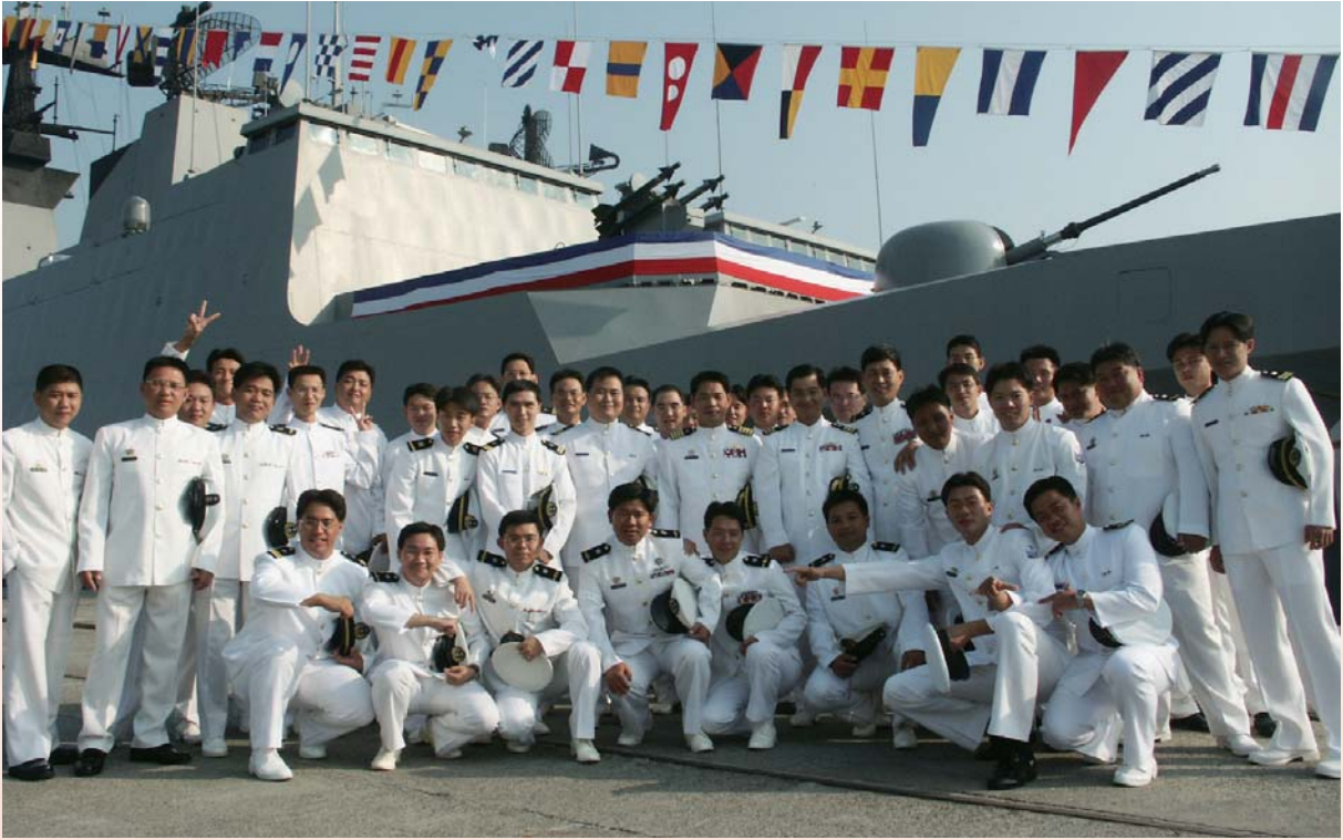
2004年11月西寧艦軍士官合影

易；更在物資條件不佳的狀況下，捍衛台海安全數十年，有更多感人的故事。筆者自己便經歷了許多故事。為何不將這些故事記錄下來，供官兵弟兄弟姐妹及社會各界參考。