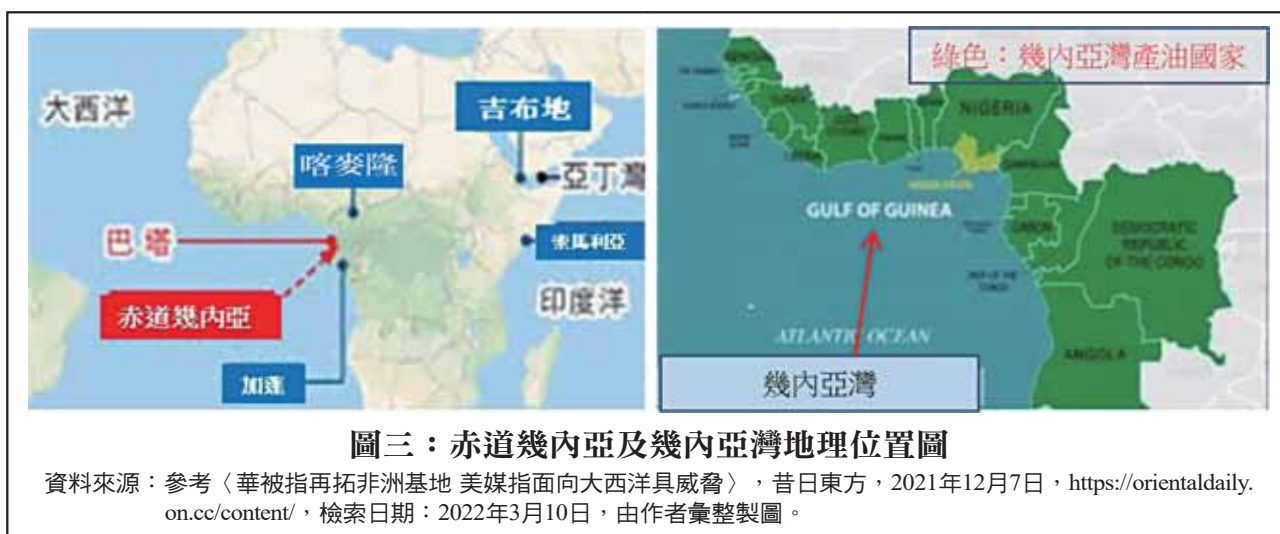
圖三：赤道幾內亞及幾內亞灣地理位置圖

資料來源：參考〈華被指再拓非洲基地 美媒指面向大西洋具威脅〉，昔日東方，2021年12月7日， https://orientaldaily.on.cc/content/ ，檢索日期：2022年3月10日，由作者彙整製圖。