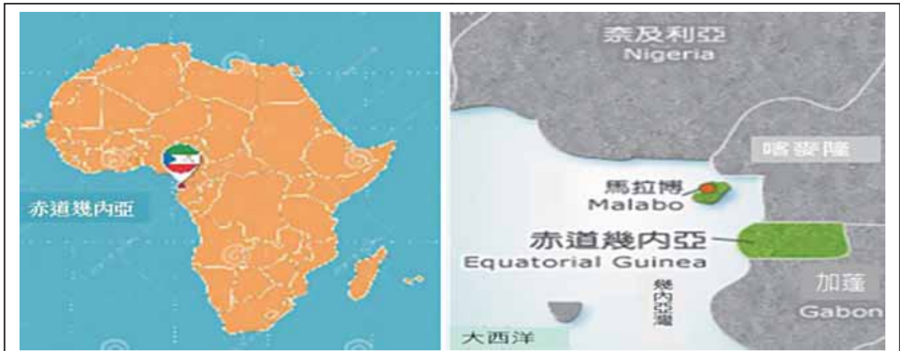
圖一：赤道幾內亞共和國地理位置圖