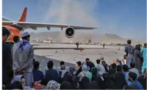
圖五：美軍撤離阿富汗喀布爾機場