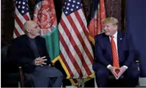
圖三：川普與前阿富汗總統會談

資料來源：〈川普突造訪阿富汗拋出已與塔利班進行和談〉，報呱，2019年12月4日， https://www.pourquoi.tw/2019/12/04/intlnews-nas-aoa-191127-191203-4/ ，檢索日期：2021年11月15日。