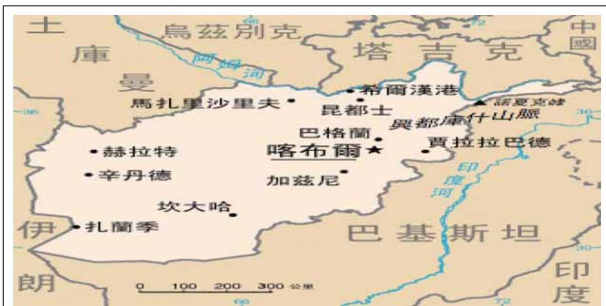
圖二：阿富汗首都地理位置圖