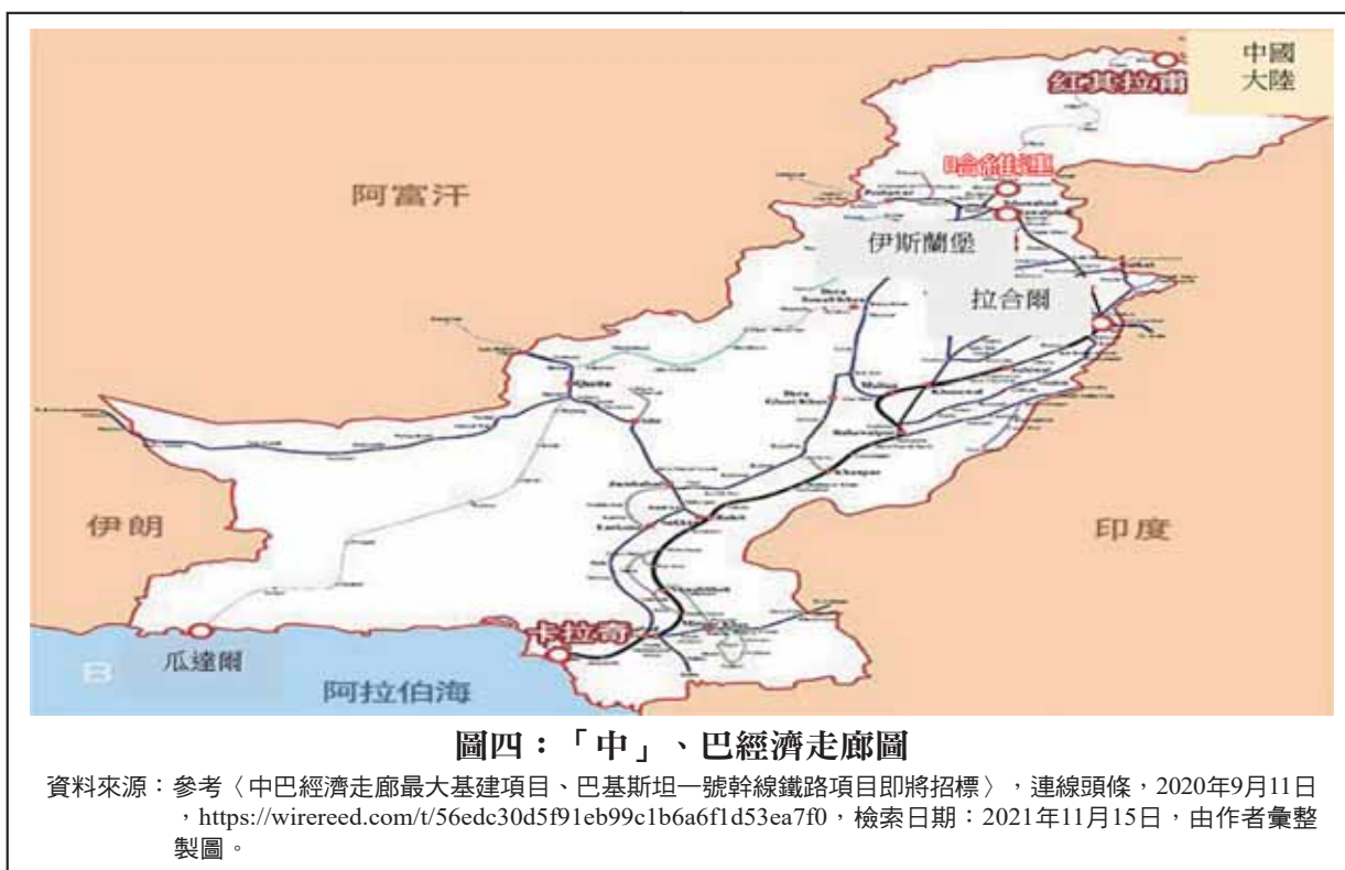
圖四：「中」、巴經濟走廊圖