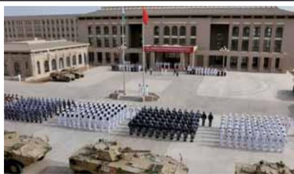
圖二：共軍駐吉布地後勤保障基地

習近平就任後，共軍的軍事戰略雖仍以「積極防禦」為核心，惟在「十九大」後所提出的「2035年基本實現國防和軍隊現代化」、「本世紀中葉建成世界一流軍隊」，已凸顯其有別於以往基於「韜光養晦」所訂定之「近海作戰」守勢思維， 54 更體現中共面對外部的挑戰，正朝向更為自信、主動與積