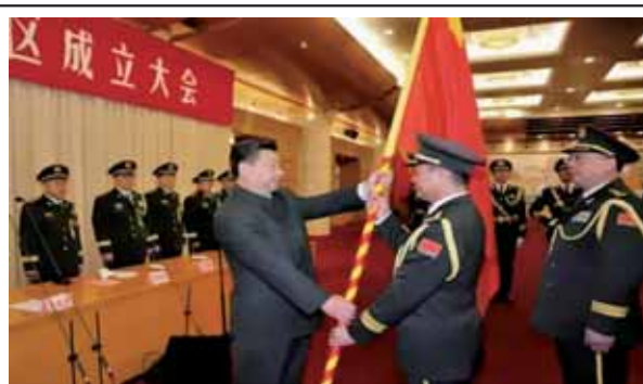
圖一：習近平主持五大戰區成立授旗大會

1. 由於共軍原「四大總部」(總參、總政、總後及總裝)權力過於集中，形成了一個介於軍委和基層部隊間的獨立指揮階層，阻礙軍委主席的集權領導， 45 因此「軍改」