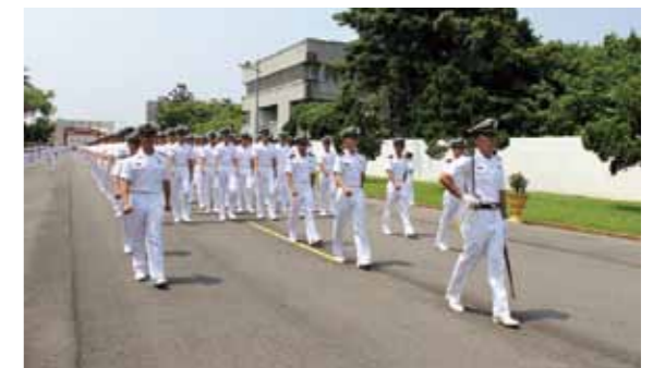
圖2 海官入伍生完成入伍訓練後回到學校

海官入伍生回海軍官校後，舉行「進校儀式」，包含「升旗（年班旗）及授徽（校徽）之禮」。新生在校旗隊、軍樂隊，及全體四年級的引領下進入校門，二年級夾道歡迎，先由校長在「精忠巨桅」主持一～四年級年班旗升旗典禮，後由總隊長於中正台前主持校徽授予典禮，在其左胸授予校徽與肩上階級後，他們即為海軍官校一年級「新生」（總隊長為入伍結訓的海官生授徽，如圖3）。從接下校徽那一刻起，各種規矩都要重來，陪伴著「新生」的就只有遵從、服從上級。他們集中在一起，