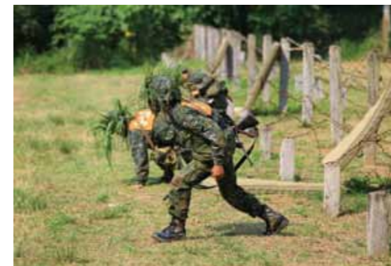
圖1 入伍訓中的震撼教育

海官入伍生回海軍官校後，舉行「進校儀式」，包含「升旗（年班旗）及授徽（校徽）之禮」。新生在校旗隊、軍樂隊，及全體四年級的引領下進入校門，二年級夾道歡迎，先由校長在「精忠巨桅」主持一～四年級年班旗升旗典禮，後由總隊長於中正台前主持校徽授予典禮，在其左胸授予校徽與肩上階級後，他們即為海軍官校一年級「新生」（總隊長為入伍結訓的海官生授徽，如圖3）。從接下校徽那一刻起，各種規矩都要重來，陪伴著「新生」的就只有遵從、服從上級。他們集中在一起，