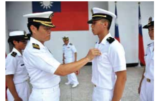
圖3 總隊長為入伍結訓的海官生授徽