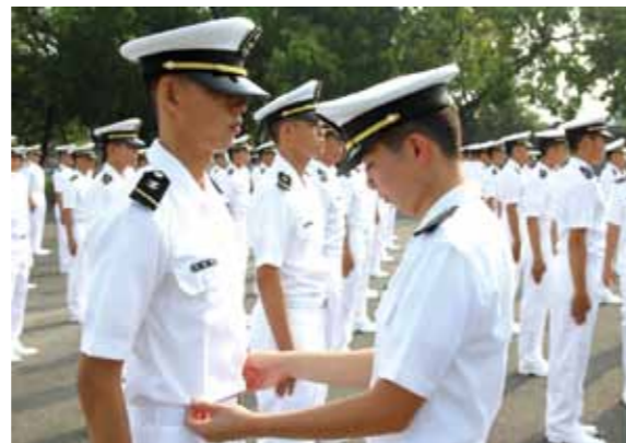
圖4 新生隊學習幹部教導新生整理服儀

新生隊解散後，新生被編配到學生總隊各中隊，成為「老生隊」的最低年班。各中隊有獨立的生活區域，以年班混合編隊為原則，寢室內4人為一間，有不同年級學生，又依照年班高低稱「室老大」、「室老二」、「室老么」等。混合編排主要目的，在使各年級學長、學弟都能彼此認識，學的是態度，培養的是情感。也就是說，培養階級倫理，進而培養年班及錨鍊精神。