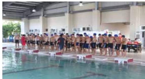
圖5 一升二的暑訓學生須完成泳訓測驗

在中隊的生活中，學長照顧學弟，學弟尊敬學長，學長與學弟間食同、住同、作息同、甘苦同。高年級學長除可在不影響常規作息的情況下，採取簡短而重點的機會教育方式外；無形中培養年班間良好的人際關係，明白應對進退的禮節，瞭解被領導人的心態及培養服從性。所以，每一位在「老生隊」中，在適度的壓力過程中塑造責任、服從與榮譽信念。所學習到的待人處事態度，都是將來畢業後服務艦隊的基礎。