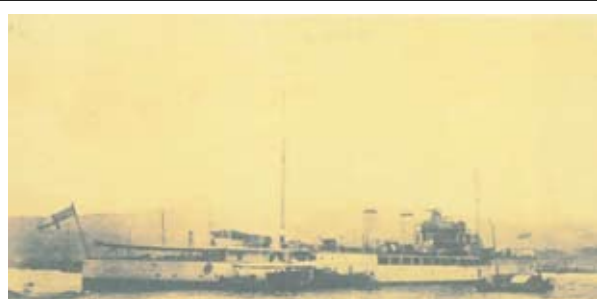
圖三 英艦密納蘭號由香港開往東沙之圖