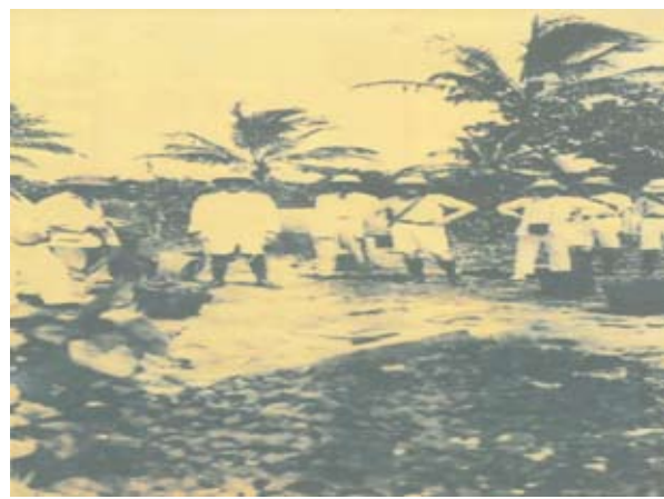
圖五 肇融在椰樹之前化驗井水及英國工程師等參觀之情形