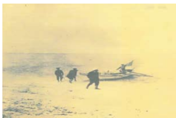
圖二 接收東沙島之林委員登該島北岸圖

資料來源：國家發展委員會檔案管理局藏，《東沙島無線電觀象臺籌建案(第1冊)》，檔號：B5018230601/0013/927/5090，總檔案號：00033191。