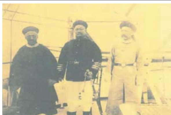
圖一 前清粵省特派接收東沙島之官員