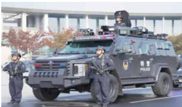
圖三：中共武警「劍齒虎」防暴裝甲車