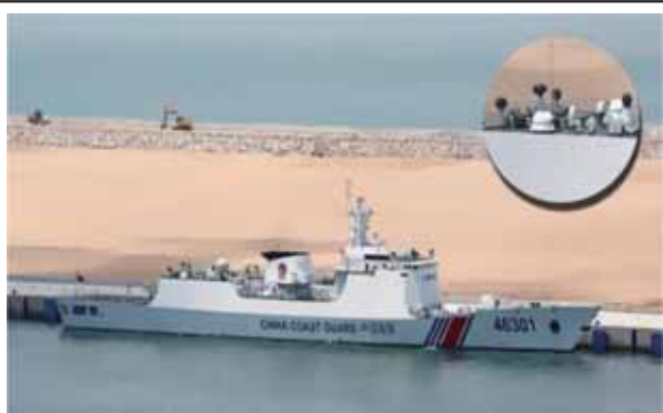
圖五：中共海警「818型」巡邏艦