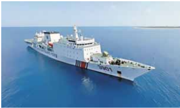
圖四：中共萬噸級之3901海警船