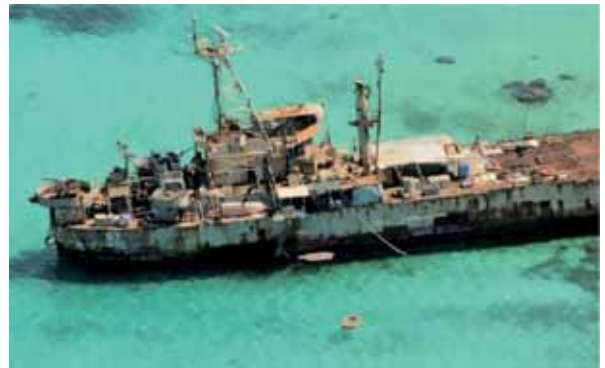
圖六：擱淺在仁愛礁的「馬德雷山號」

自2018年海警納入中央軍委統一領導後，其基本任務屬性並未改變，仍常態性於釣魚台附近海域活動，但活動次數有越來越頻繁之趨勢。2020年，中共海警船航行進入釣魚台鄰接區海域的天數高達333天，創下歷年來的紀錄，而2021年也有332天，可以看出中共海警幾乎全年無休的在該海域進行「維權」任務。 49 中共如此頻繁地派遣海警船