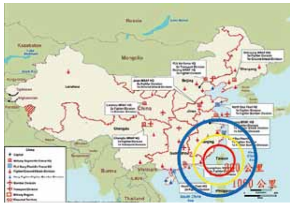
圖二：重層嚇阻之防禦圈示意圖