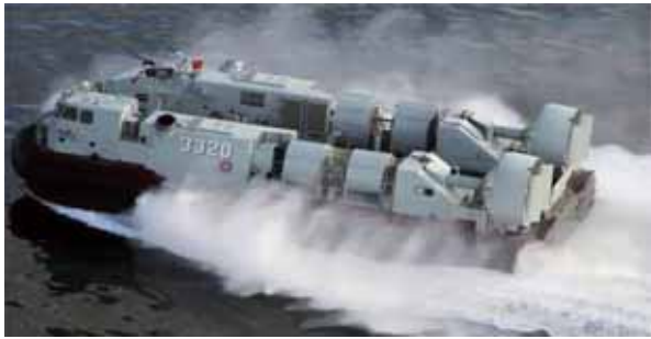
圖四：中共海軍726型氣墊登陸艇