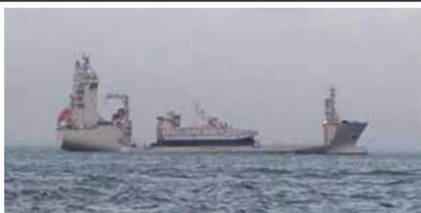
圖六：中共 868「東海島」號半潛船