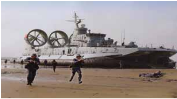
圖五：中共海軍野牛級氣墊登陸艇

資料來源：〈中共登陸艇批量生產，海軍兩棲作戰能力極大提升〉，每日頭條，2017年11月6日， https://kknews.cc/military/3xjvl3a.html ，檢索日期：2020年2月25日。