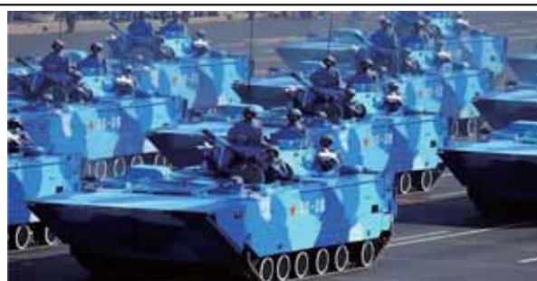
圖三：ZBD-05式兩棲裝甲突擊車

2. 從中共在2013年9月舉行的「使命行動-2013」及2015年7月於南海海域進行「多兵種立體登陸作戰演練」等軍演中發現，