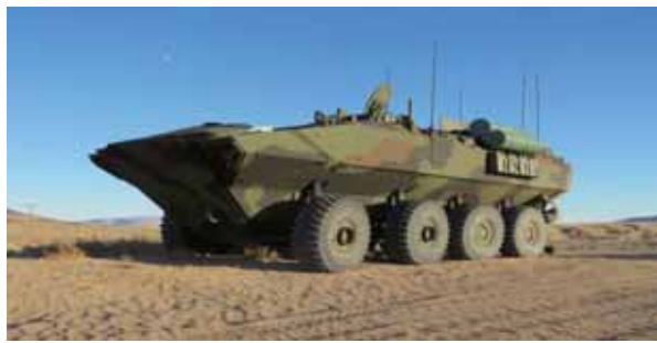
圖七：美軍兩棲戰鬥車 (ACV)