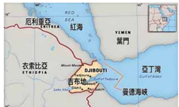
圖一：東非吉布地位置圖

中共海權發展快速擴張，除建設水面艦艇與無人艦艇之外，亦積極在南海從事「填礁造島」，並於印太海域建構海外基地。2017年7月，在東非國家吉布地(Djibouti)建立第一個海外軍事基地(如圖一)，成為共軍向地中海展開戰略部署的跳板。因該基地位置處於亞丁灣與紅海交界處，可扼控蘇伊士運河咽喉，其海洋戰略價值更為中共帶來