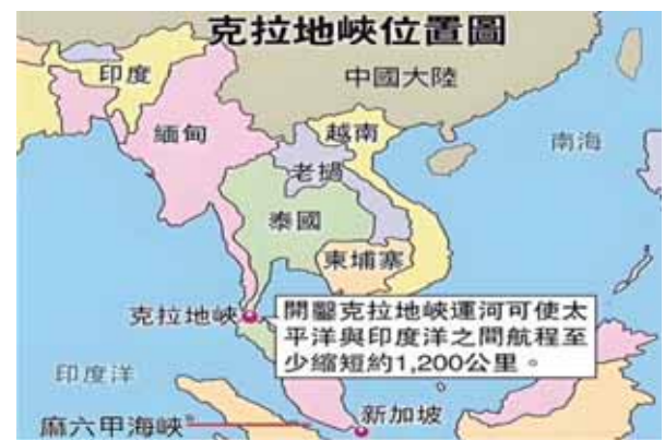
圖五：克拉地峽位置圖