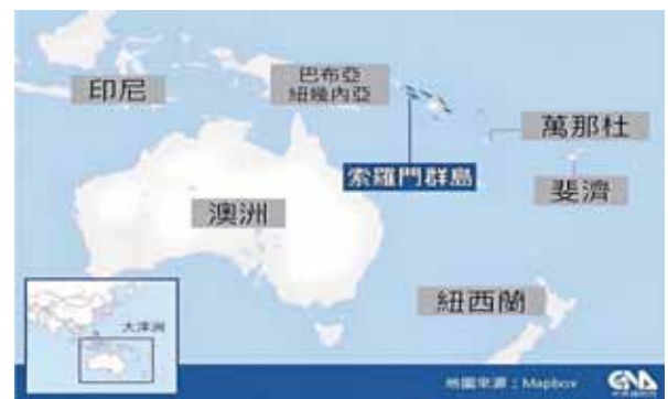
圖八：南太平洋島國位置圖

1. 2022年5月26日至6月4日，中共外交部長王毅訪問索羅門群島、斐濟和巴布亞新幾內亞等10個南太平洋島國(如圖八)， 25 並提出「中國-太平洋島國共同發展願景」，合作領域從教育、人文交流、健康、氣候變