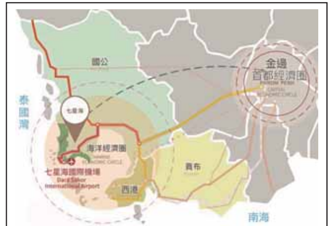
圖四：柬埔寨七星海國際機場示意圖

中共與泰國正協商在克拉地峽開鑿「克拉運河」(Kra Canal)，該運河全長102公里，寬400公尺、平均水深20公尺，東面是泰國灣，西面則是安達曼海(Andaman Sea)，此處是馬來半島東西向間最窄之處(如圖五)。若修建完成後，由雲壤港可更快速連接該運河，屆時從太平洋進入印度洋較現今取道麻六甲海峽的航程至少縮短約1,200公里，節省2~5天的航程；如以10萬噸油輪計算，每趟航程約可節省運費35萬美元(折合新臺幣約1,130萬)， 10 同時避開航行麻六甲海峽擁擠的航運，更快通往印度洋，並降低中共能源進口對於麻六甲海峽的依賴。對中共而言，除突破能源運輸的脆弱性外，間接也擴展海上交通線的具體應用。