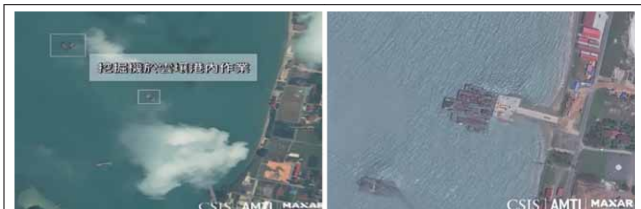
圖三：柬埔寨雲壤港衛照圖

資料來源：參考〈UPDATE: DREDGED PIER CONSTRUCTED AT REAM〉，Center for Strategic and International Studies，JULY 18, 2022， https://amti.csis.org/dredgers-spotted-at-cambodias-ream-naval-base/ ；〈CONSTRUCTION AT CAMBODIA'S REAM PICKS UP PACE〉，Center for Strategic and International Studies，OCTOBER 18, 2022， https://amti.csis.org/construction-at-cambodias-ream-picks-up-pace/ ，檢索日期：2022年12月16日，由作者彙整製圖。