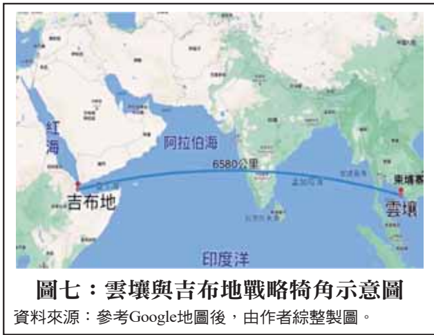
圖七：雲壤與吉布地戰略犄角示意圖