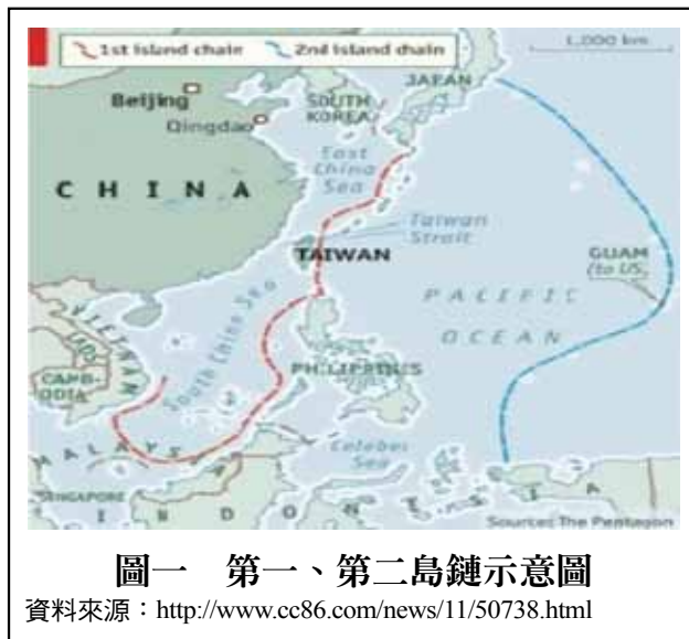
圖一 第一、第二島鏈示意圖

自1980年代以後，國際局勢總體緩和，當時中共領導人鄧小平審時度勢積極推動「改革開放」政策，將國家安全及經濟重心由內陸轉移至沿海省份。也由於改革開放政策，中共的經濟大幅成長，對於海外石油等能源日益迫切，更加重視海上安全問題。另外，此一時期，中蘇關係緩和，中共來自陸上的威脅逐漸消退，但在海洋國土的爭議卻日益嚴重，再加上1982年《聯合國海洋法公約》(United Nations Convention on the Law of the Sea)提出後，中共對於海洋權益的爭取，有了更深刻體認，開始放眼海洋，並逐步發展海權與海軍的建設 8 。具體的