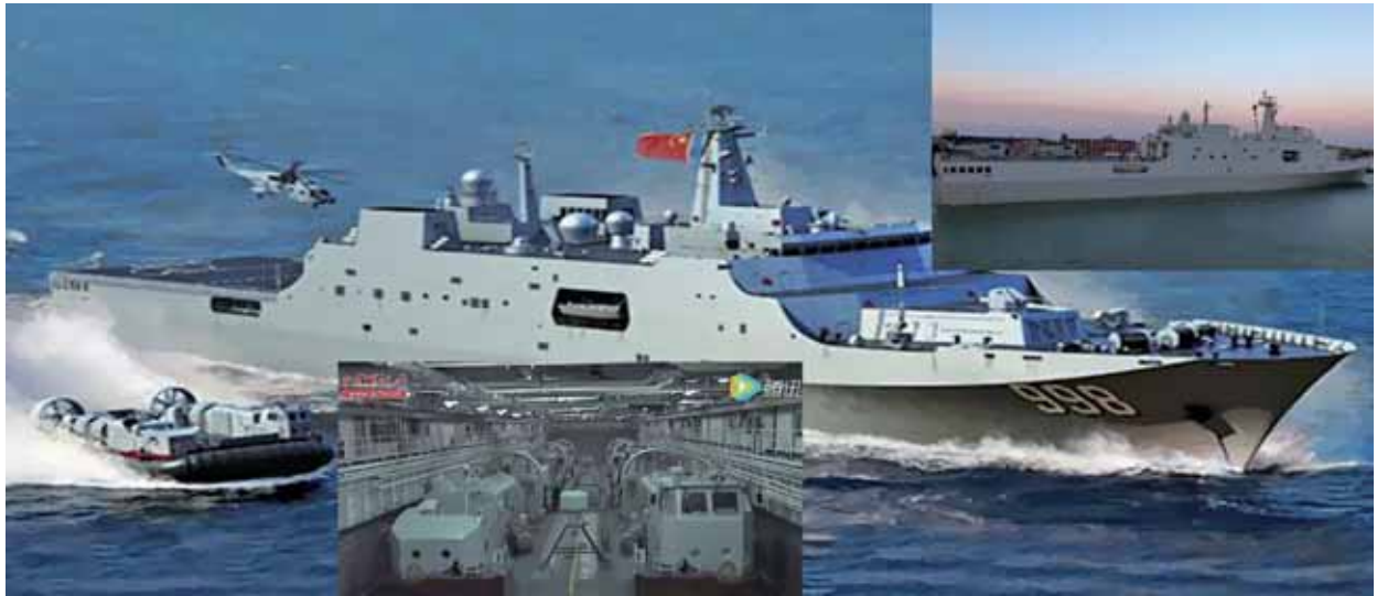
圖五：「071型」船塢登陸艦裝(搭)載氣墊船、直升機

說明：「071型」艦可運用艦船之船塢及機庫等空間，靈活裝(搭)載各式兩棲運輸載具，如兩棲突擊車、氣墊船及直升機等，藉以遂行各式登陸作戰。