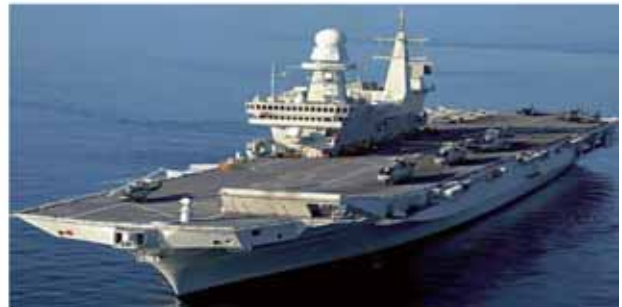
義大利「加富爾號」航艦