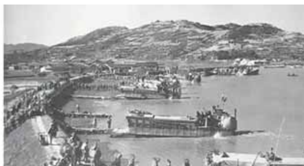
1955年「一江山」登陸戰役