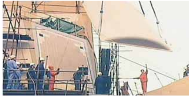
艦用「346型」有源相控陣雷達