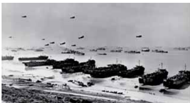
1944年美軍「諾曼第」登陸作戰