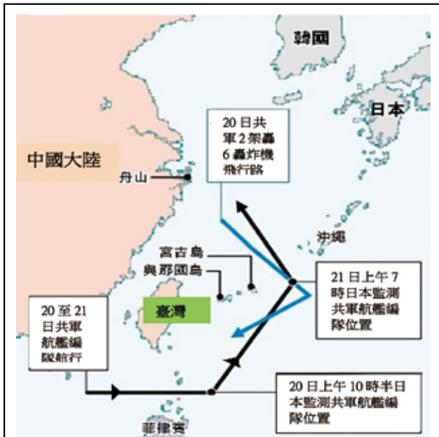
圖二：2018年中共航艦編隊繞臺航線示意圖