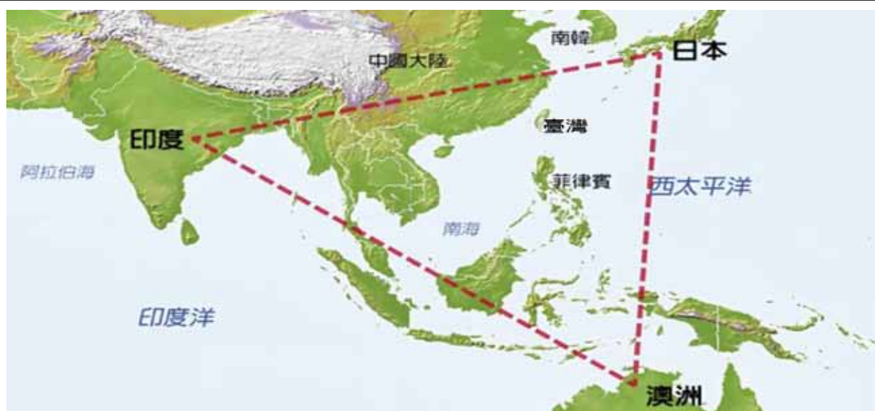
圖四：印太戰略位置圖