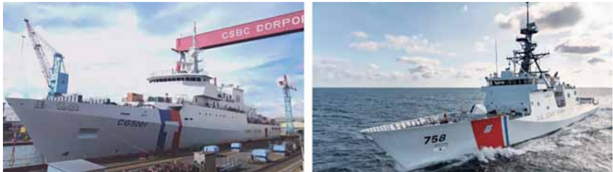
圖二：海巡「嘉義級」巡防艦(圖左)與美國海岸防衛隊「傳奇級」(圖右)比較圖