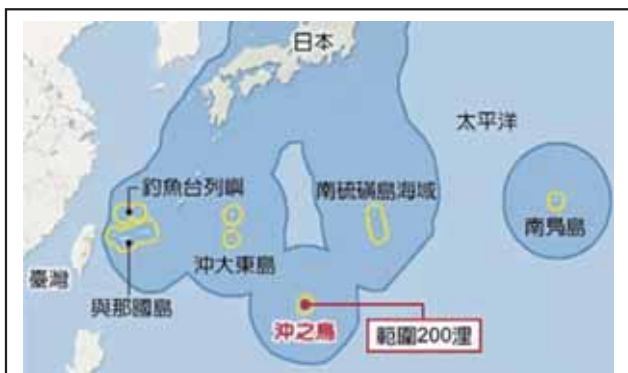
圖五：沖之鳥海域位置圖