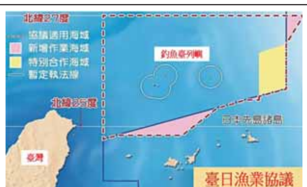
圖六：臺日漁業協議適用海域示意圖