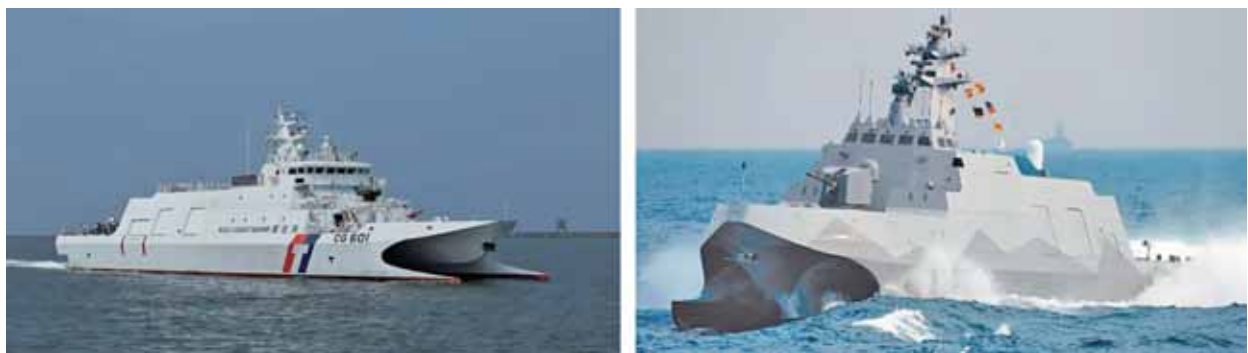
圖三：海巡「安平級」巡防艦(圖左)與海軍「沱江級」(圖右)比較圖