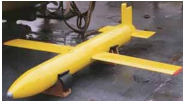
圖七：「堅忍」(Sterne)型水下滑翔機