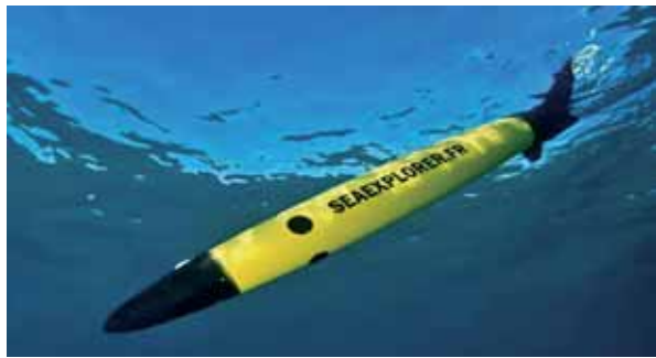
圖六：「海洋探測」(Sea-Explore)型水下滑翔機