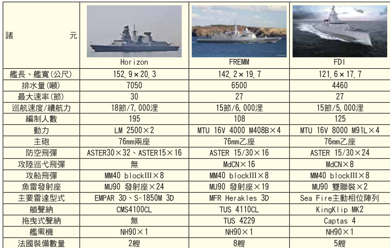
表二：地平線級、歐洲多功能巡防艦與FDI巡防艦性能諸元表

資料來源：參考Bernard Prézélin, flottes de combat(Rennes : Martimes et d' Outre Mer, 2012), pp.20-24。〈Frigates de taille intermédiaire〉，維基百科， https://en.wikipedia.org/wiki/Frigates_de_taille_intermediaire ，檢索日期：2020年12月28日，由作者自行綜整製表。