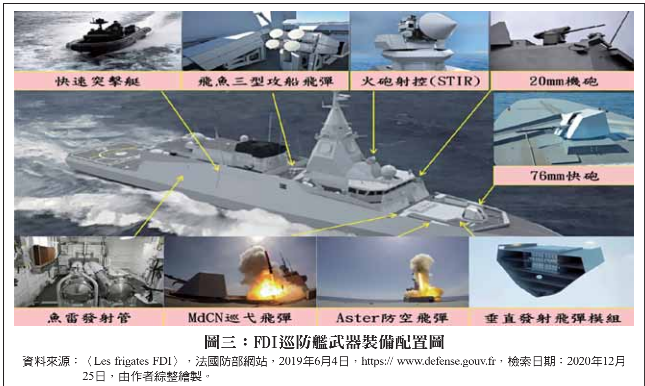
圖三：FDI巡防艦武器裝備配置圖