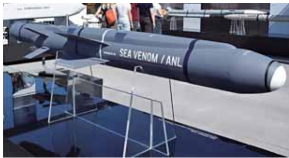
圖五：海妖攻船飛彈