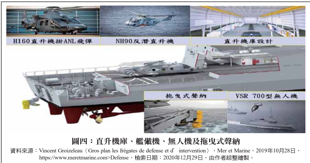
圖四：直升機庫、艦載機、無人機及拖曳式聲納