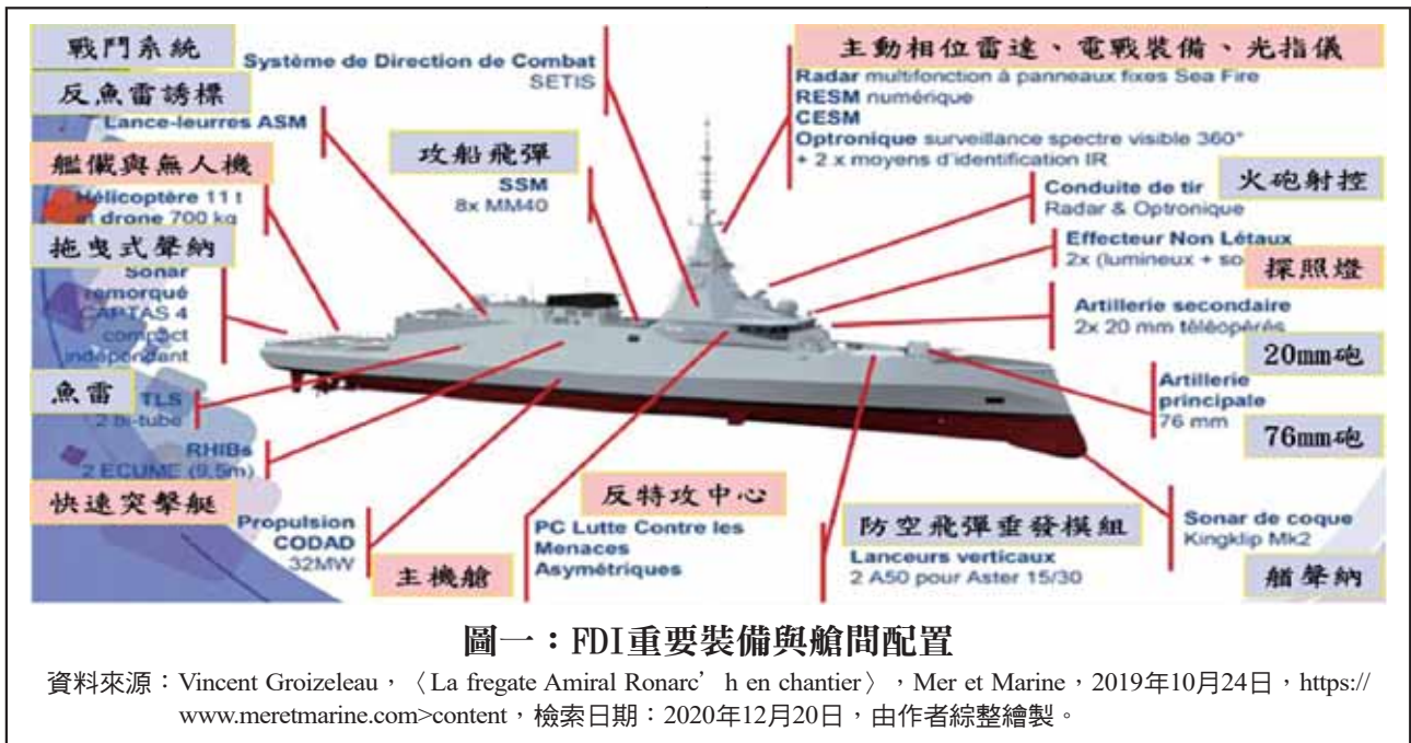
圖一：FDI重要裝備與艙間配置

資料來源：Vincent Groizeleau，〈La frégate Amiral Ronarc' h en chantier〉，Mer et Marine，2019年10月24日， https://www.meretmarine.com/content ，檢索日期：2020年12月20日，由作者綜整繪製。