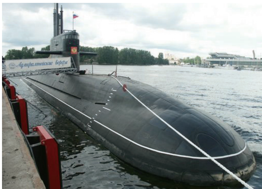
屬港口城市的克隆斯塔德 (Cronstadt) 是俄羅斯波羅底海艦隊主要基地之一，圖為一艘停泊於基地的潛艦

語，在韓、日之間的對馬海峽迎戰若似來勢洶洶、但其實卻已疲累困頓的俄羅斯波羅底海艦隊。日本艦隊一鼓作氣的大敗俄羅斯艦隊，俄方的瓦良格號巡洋艦等艦艇紛被擊沈，餘者又分別遭致重創或逃散而潰不成軍。俄羅斯只得接受美國老羅斯福總統 (Theodore Roosevelt) 的調停，於9月5日假美國東岸緬因州境的樸資茅斯 (Portsmouth) 海軍基地簽訂《樸資茅斯和約》 8 。