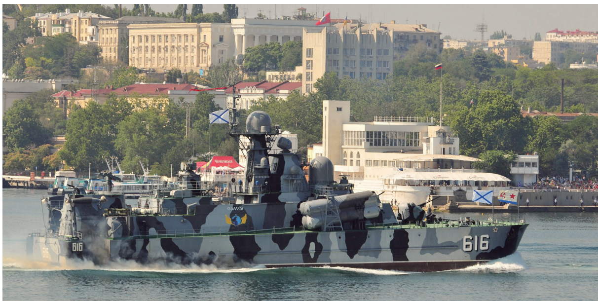
一艘編號為616的俄羅斯黑海艦隊麾下水翼船軍艦正駛過其領海

底海艦隊畢竟因為巡守的海域範圍較小，難以擴張陣仗，故在武力配置和聲勢上，自然難以和最強盛的北方艦隊（建於1933年）、太平洋艦隊（建於1932年）相提並論，其規模係比較接近於黑海艦隊（創建於1783年的凱撒琳大帝主政期間，是循波羅底海艦隊為基礎而仿建，為俄羅斯第二支遠洋艦隊）。