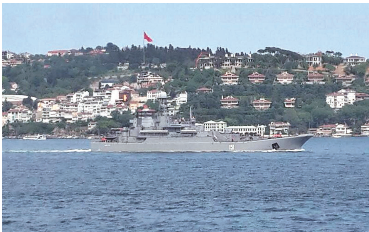
一艘編號為151的俄羅斯軍艦正駛過其領海

懼，儘求避免在海戰中和其交鋒。波羅底海艦隊的戰功和聲威，讓俄羅斯堂而皇之的登臨國際舞台，其海軍既縱橫於浩瀚大洋，陸軍亦雄峙騁於跨洲大地，各國鮮能奪其鋒纓。