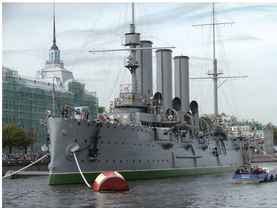
已除役並停泊於聖彼得堡，轉作為軍艦博物館的「阿樂拉號」巡洋艦 (The Cruiser Aurora, 又稱極光號)，在昔之十月革命時倒戈投向共產陣營

於3月15日曾提出偕同王儲共同退位，改由其弟接任帝位之方案，但是由甚多海、陸軍部隊的支持的革命黨拒絕此案，眾方推派克倫斯基出任政府總理，但是沙皇仍然暫為已經大權旁落的國家元首。另由列寧和托洛斯基、季維諾夫領導的布爾什維克黨員，復於同年11月7日再度武裝起事，建立無產階級政權的蘇維埃社會主義國家，沙皇正式遜位（翌年7月17日凌晨，全家慘遭殺害），羅曼諾夫王朝於焉終結，因為當下的舊儒略曆時為10月，故史稱「十月革命」。