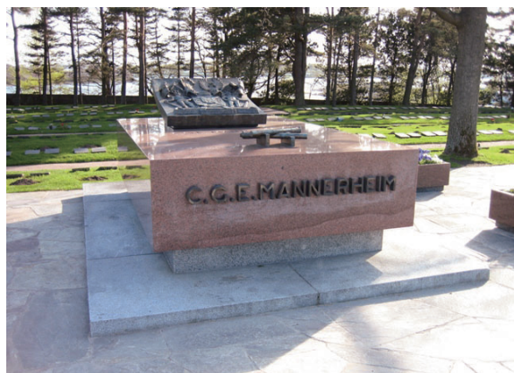
二次世界大戰結束後，芬蘭於曼納林防線 (Mannerheim Defense) 舊地建造的紀念物

除了巡守波羅底海海域之外，艦隊還同步派出軍艦、兵力以捍衛列寧格勒沿岸和楚德湖、拉多加湖、奧涅加湖等水域。不過，納粹海軍的裝備武器遠較蘇聯海軍優良，精良的潛艇部隊更是神出鬼沒，而且納粹德國建