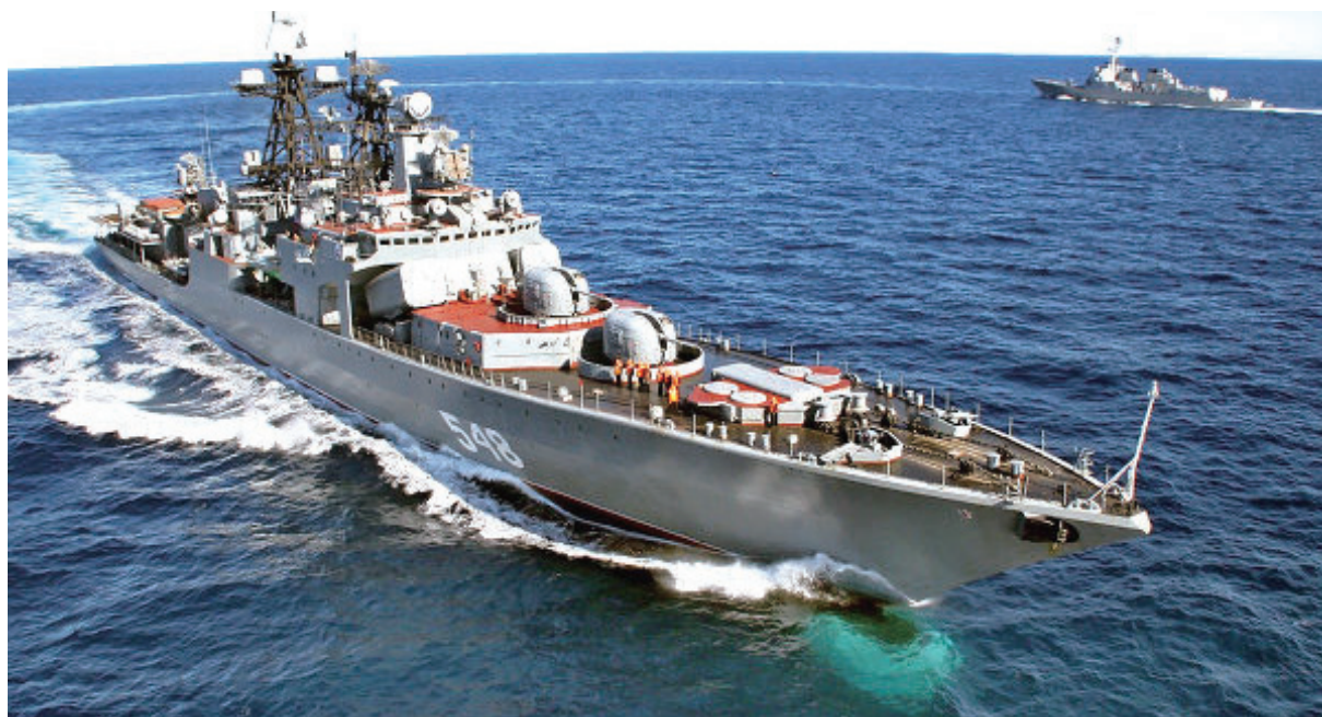
俄羅斯波羅底海艦隊麾下的無畏號(俄語發音Neustrashimy)護衛艦