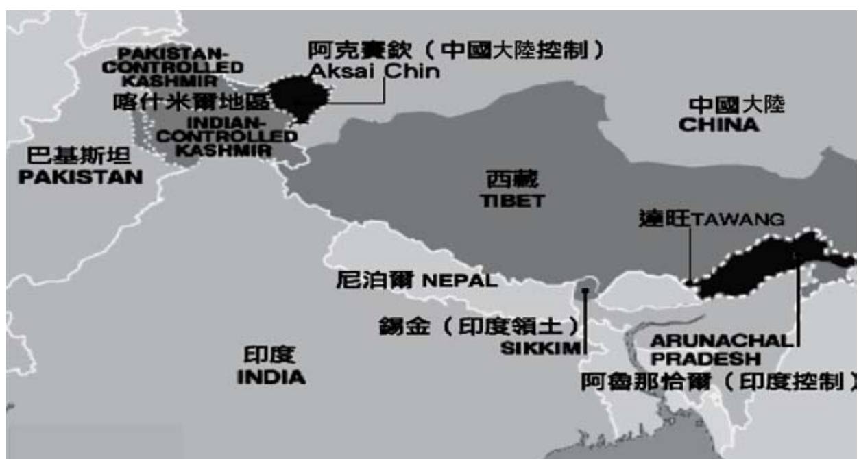
圖一 中、印邊界爭議領土示意圖

資料來源：陳牧民，〈領土主權與區域安全—中印領土爭議分析〉，《臺灣國際研究季刊》，第1期，2009年，頁170。