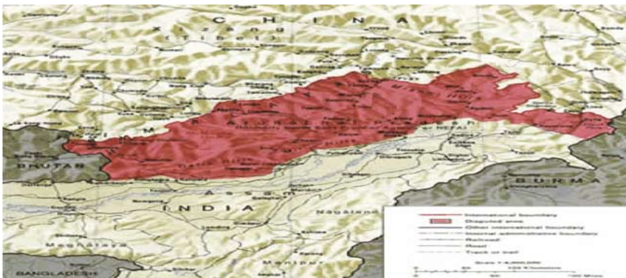
圖三 中、印邊界東段爭議領土示意圖