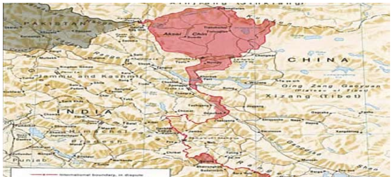
圖二 中、印邊西段與中段爭議領土示意圖