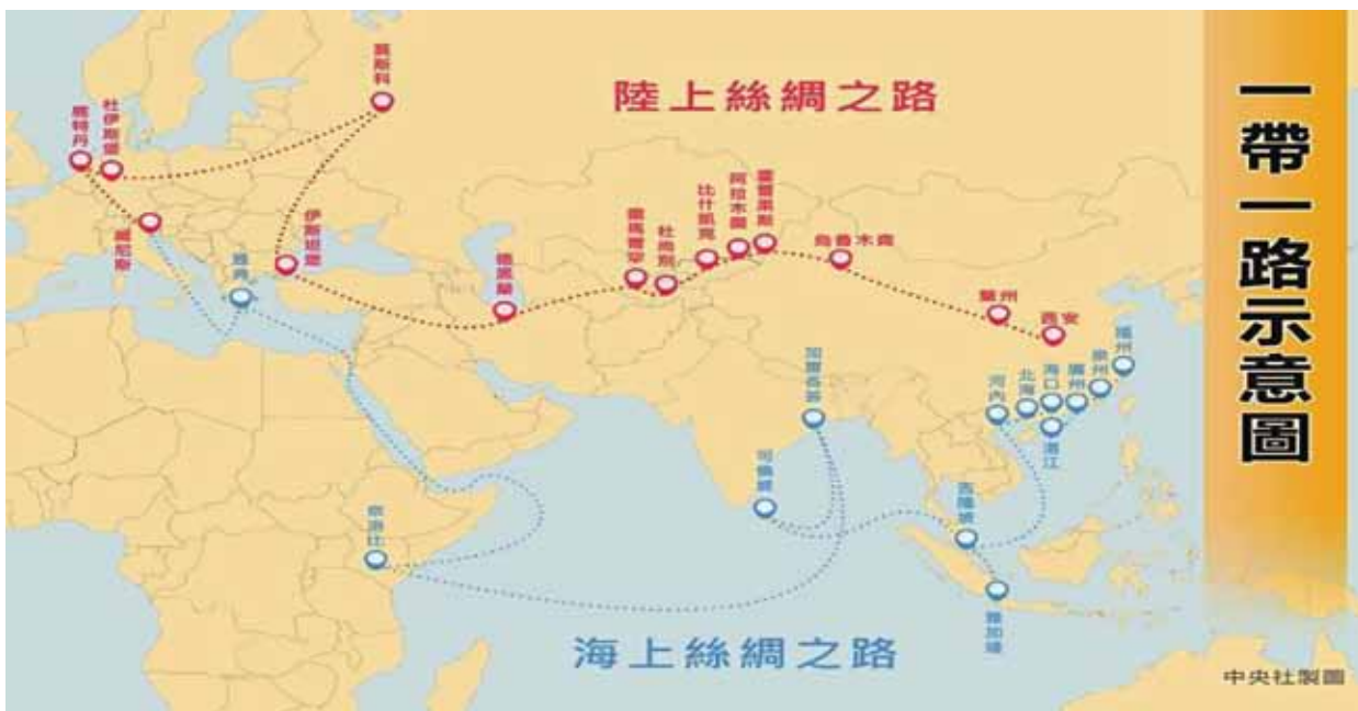
附圖 中共一帶一路示意圖