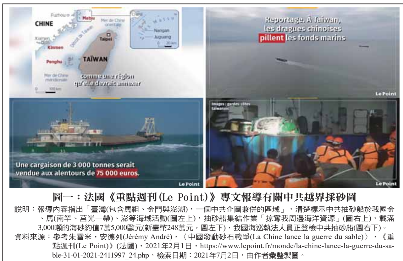
圖一：法國《重點週刊(Le Point)》專文報導有關中共越界採砂圖

說明：報導內容指出「臺灣(包含馬祖、金門與澎湖)，一個中共企圖兼併的區域」，清楚標示中共抽砂船於我國金門、馬(南竿、莒光一帶)、澎等海域活動(圖左上)，抽砂船集結作業「掠奪我周邊海洋資源」(圖右上)，載滿3,000噸的海砂約值7萬5,000歐元(新臺幣248萬元，圖左下)，我國海巡執法人員正登檢中共抽砂船(圖右下)。