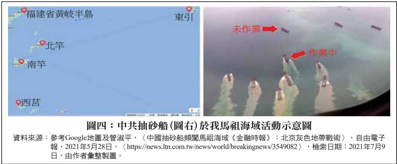
圖四：中共抽砂船(圖右)於我馬祖海域活動示意圖

資料來源：參考Google地圖及管淑平，〈中國抽砂船頻闖馬祖海域《金融時報》：北京灰色地帶戰術〉，自由電子報，2021年5月28日，〈 https://news.ltn.com.tw/news/world/breakingnews/3549082 〉，檢索日期：2021年7月9日，由作者彙整製圖。