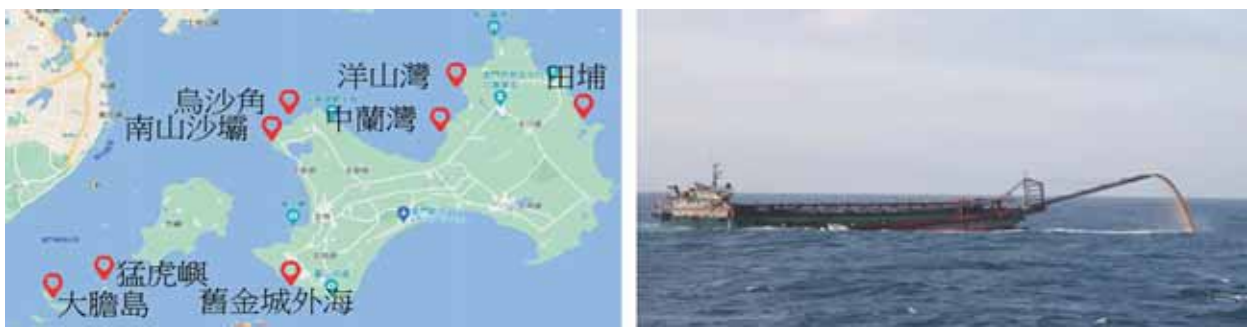
圖二：中共抽砂船(圖右)於我金門海域活動示意圖