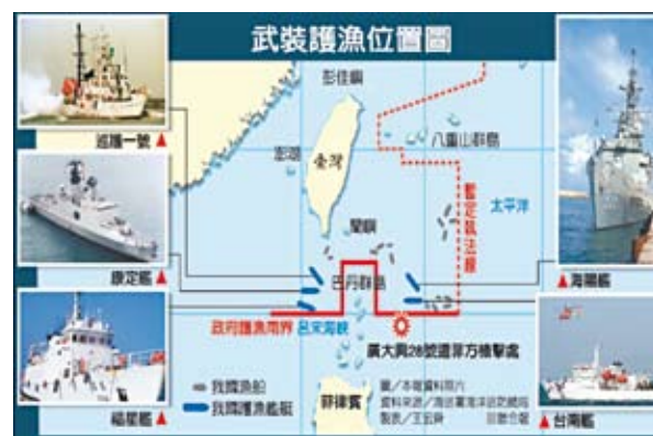
圖二 海軍及海巡聯合護漁執法