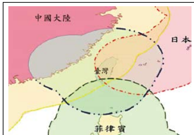
圖一 臺灣與周邊國家經濟海域重疊範圍圖

政府決議於5月16日由國防部海軍司令部派遣海軍基隆及康定級艦擔任主要兵力，並協同行政院海岸巡防署(簡稱海巡署)數艘艦艇共同於「暫定執法線」 1 北緯20度線執行聯合護漁任務。「護漁」及「海域執法」等任務在過去是由海軍所擔負 2 ，然在2000年行政院海岸巡防署成立後，由海巡署擔任執法第一線，海軍負責第二線策應任務。海巡署亦於2001年與國防部簽訂(頒布)雙方之協調辦法，其中之綜合支援協定書中已明白闡述「甲方主要任務為海域執法，乙方主要任務為制海」之海域執法原則；雖該協調辦法第17條又敘述「海巡署所屬機構執行巡防任務時，得請求國防部所屬機構、部隊支援。」 3 (如圖一、圖二)，另就《中華民國領海及鄰接區法》中第17條及《中華民國專屬經濟海域及大陸礁層法》第16條兩個條款中，亦明確賦予海軍在既有法源規範下之執法依據。就近期臺、菲漁業協商遲遲無進展，菲律賓又倚仗美國於背後支持，對我國提出之相關協議表示無法接受，並強勢對於臺菲重疊海域作業之我國籍漁船執行驅趕及逮捕作為，相信雙方衝突將日益升高，就現況而言，如海巡署依支援協定協請海軍支援，以現階段海軍已退出執法作業多年的狀況下，海軍執法能量是否足以支持海域執法，實值得深思！本文擬以下列兩個面向探討海軍協助海域執法的能量；一、法制規範面：探討海軍行海域執法之角色定位、必要性及法源依據