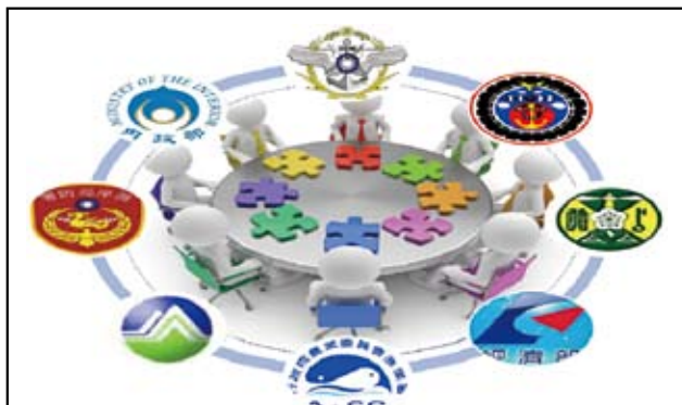
圖三 我國海域執法機關