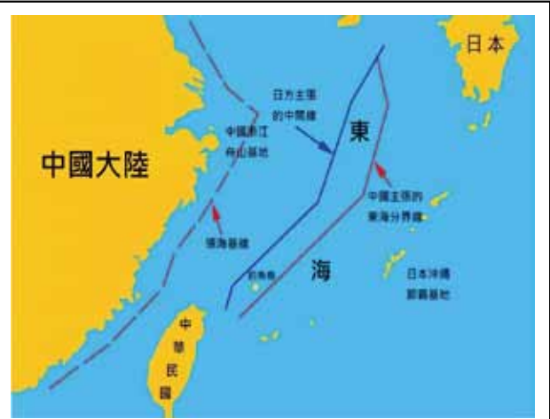
圖三：中日東海主權主張示意圖

南海海域大致可劃分為兩區域，一是東北部和東部的深水區，二是西部和南部的大陸架區域。大陸架區域包括從臺灣海峽經北部灣延伸到其他大陸架的海床，在大陸架上有許多小島嶼和淺灘，包括東沙(Pratus Islands)、中沙(Macclesfield Islands)、西沙(Paracel Islands)及南沙(Spratly Islands)四個群島。就島嶼主權爭端而言，所涉及的區域包括南沙(含黃岩島)和西沙群島。西沙群島方面為與越南的爭端，1974年中共收復被越南侵占的西沙永樂群島，但越南仍不放棄對該群島的主權要求；南沙群島