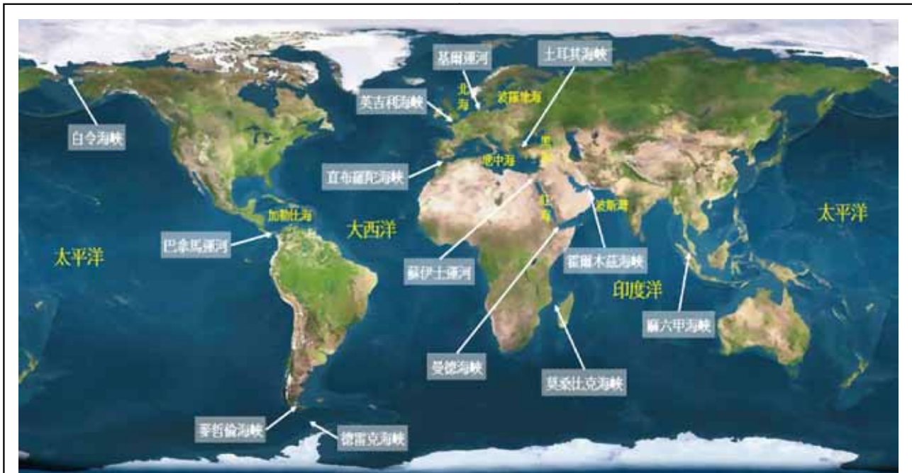
圖四：世界主要海上咽喉要道