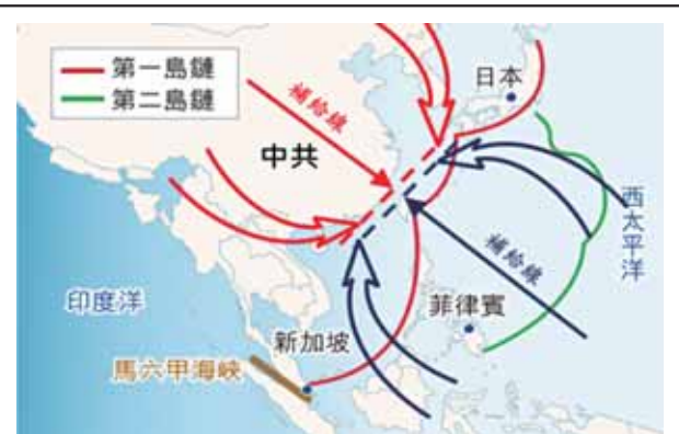
圖一：我國雙線防禦戰略態勢示意圖

防衛作戰戰略構想係為取得戰爭勝利，而依「打、裝、編、訓」的建軍思維，「不對稱作戰」之具體作為屬於「打」的範疇，先確定如何打，才有如何「裝」、「編」、「訓」的整備；「打」是軍事戰略構想的靈魂，更是國軍部隊建軍、備戰的核心思想。相關重點分析如下：