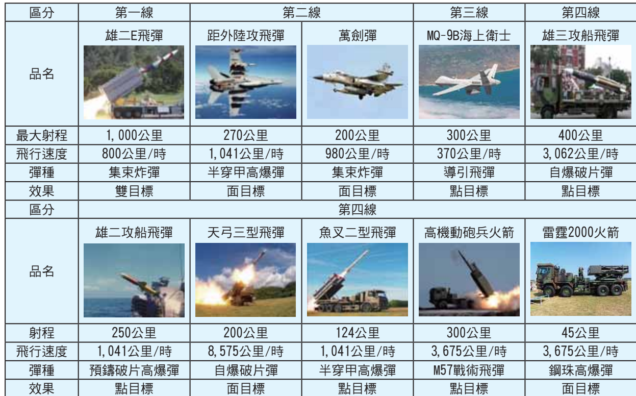
表三：國軍建構多層次防空作戰網主要武器裝備表

資料來源：參考陳宇陽、謝志淵，〈從美軍「多領域作戰」發展探討國軍源頭打擊能力建構與運用〉，《海軍學術雙月刊》(臺北)，第55卷，第3期，2021年6月1日，頁95，由作者彙整製表。