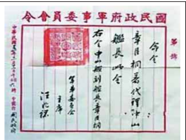
圖三：國民政府軍事委員會簽發章臣桐代理艦長委任狀

2. 此一事件讓國民黨內反對「容共」政策的人員大為振奮，並順勢奪回黨內的主導權，也讓時任國民政府主席、中央政治會議主席及軍事委員會主席的汪氏負氣稱病，致國民黨高層權力真空；此後蔣中正先生接任軍事委員會主席，由其主導的國民黨時代也正式揭開序幕 53 。