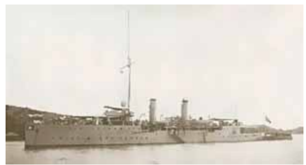
圖一：中山艦(永豐艦)原貌