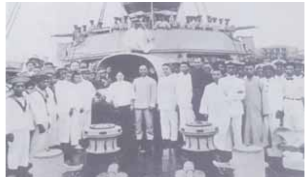
圖二：國父孫中山先生與宋慶齡女士登永豐艦合影

國父孫中山先生的廣州蒙難經歷，源自於陳炯明的叛變，這段經歷改變了他對軍閥與共產黨員的看法，背景及過程概要如后：