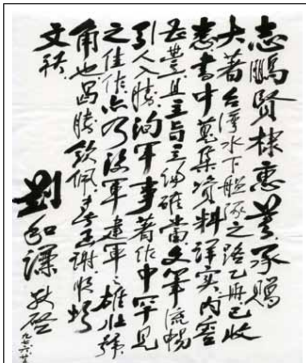
圖四：前總統府戰略顧問海軍上將劉和謙給作者的親筆書函

系統而有效地傳遞。而各類型期刊其屬性與審查制度嚴謹程度各有不同，學術位階較高者為「社會科學引用文獻索引(Social Sciences Citation Index, 簡稱SSCI)」 3 。研究論文刊登在SSCI所認證的期刊上，代表研