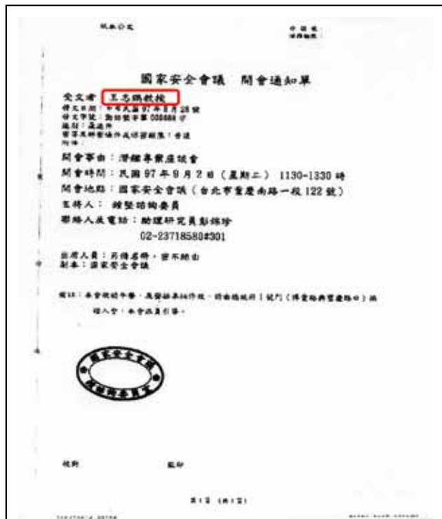
圖三：2008年9月2日受「國家安全會議」邀請進行「潛艦專案報告」