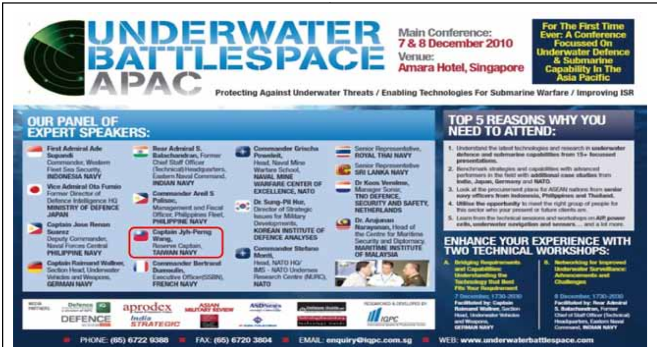
圖五：2010年於新加坡召開國際性的「潛艦技術發展研討會」（如紅圈所示）