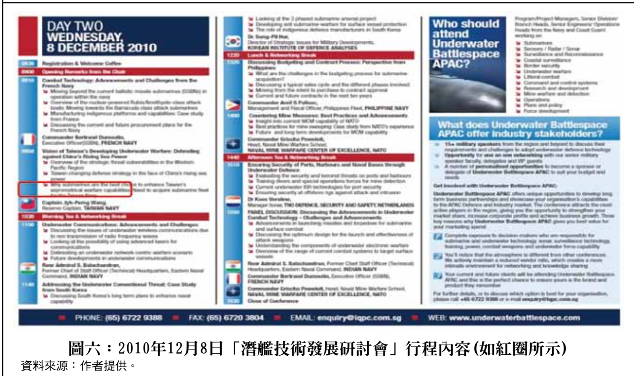
圖六：2010年12月8日「潛艦技術發展研討會」行程內容(如紅圈所示)