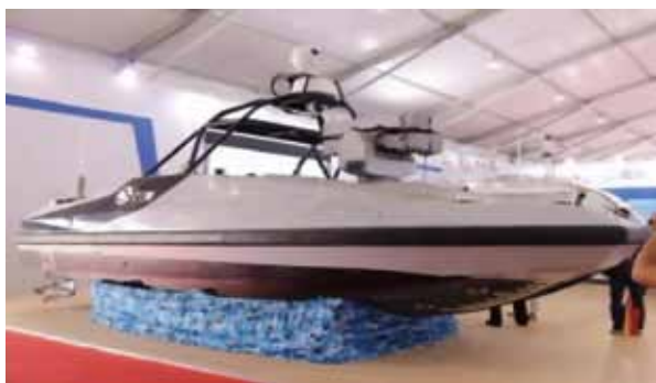
圖五：中共在珠海航展中之無人導彈快艇