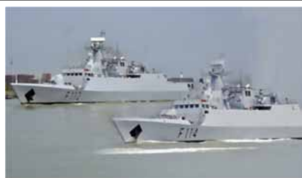
圖三：孟加拉向中共所購買的外銷版056型護衛艦

中共將孟加拉視為戰略合作夥伴，由於孟國與周邊印度、緬甸等國家長期有著海域劃界方面的爭端，直至2012年與2014年孟加拉才分別與緬甸及印度解決海域劃界的問題 13 。中共為了協助其鞏固海上疆土，給予該國軍售的內容有很大一部分是海軍，如「明級」潛艦與外銷版之056型護衛艦，此外吉大港為「一帶一路」重要的珍珠鍊一環 14 ，所以孟加拉也成為中共極欲拉攏的對象。在2014-2018年間，其向中共採購的軍備大約