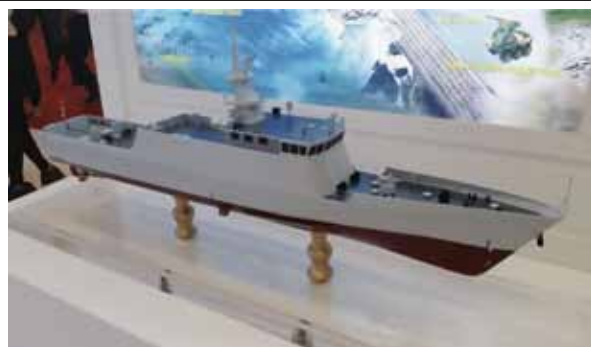
圖四：馬來西亞向中共採購之濱海戰鬥艦模型